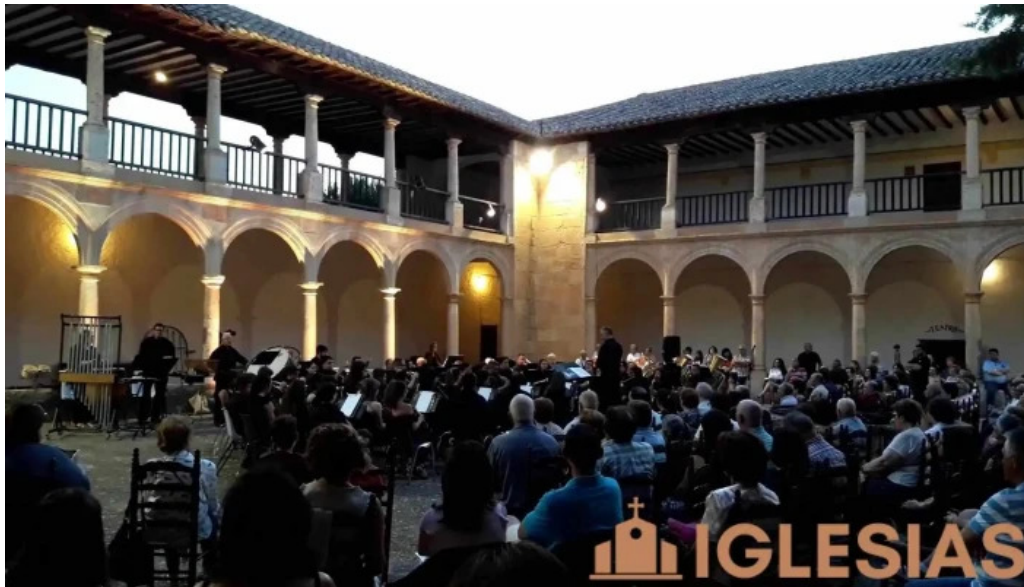
Santuario de ntra sra de los remedios videos