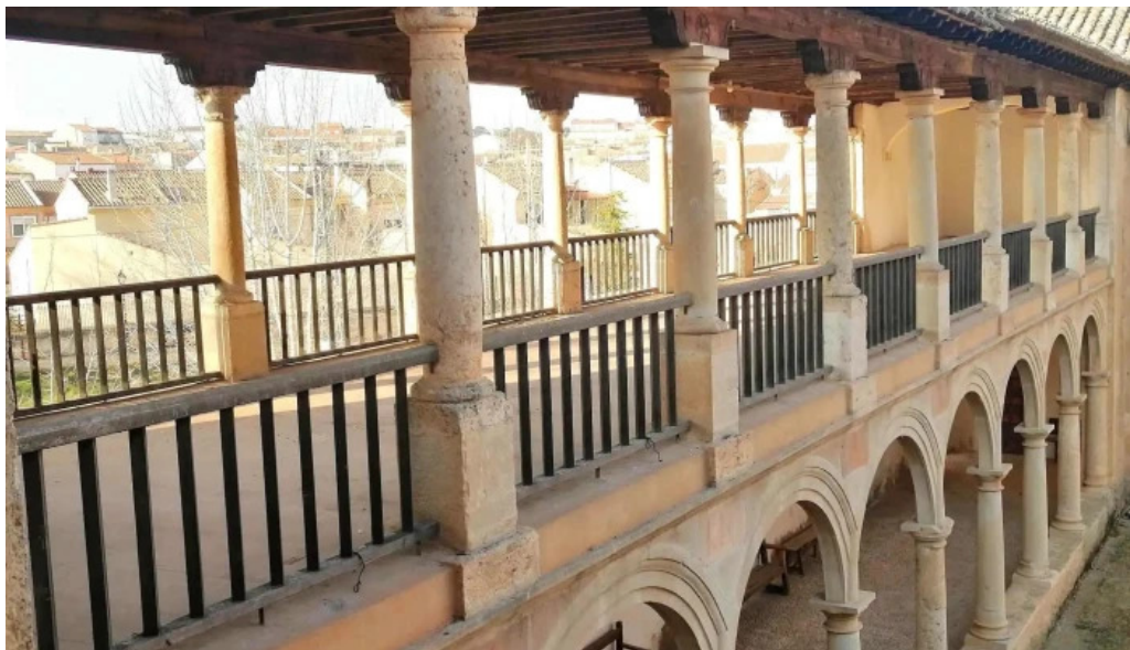
Santuario de ntra sra de los remedios ubicacion