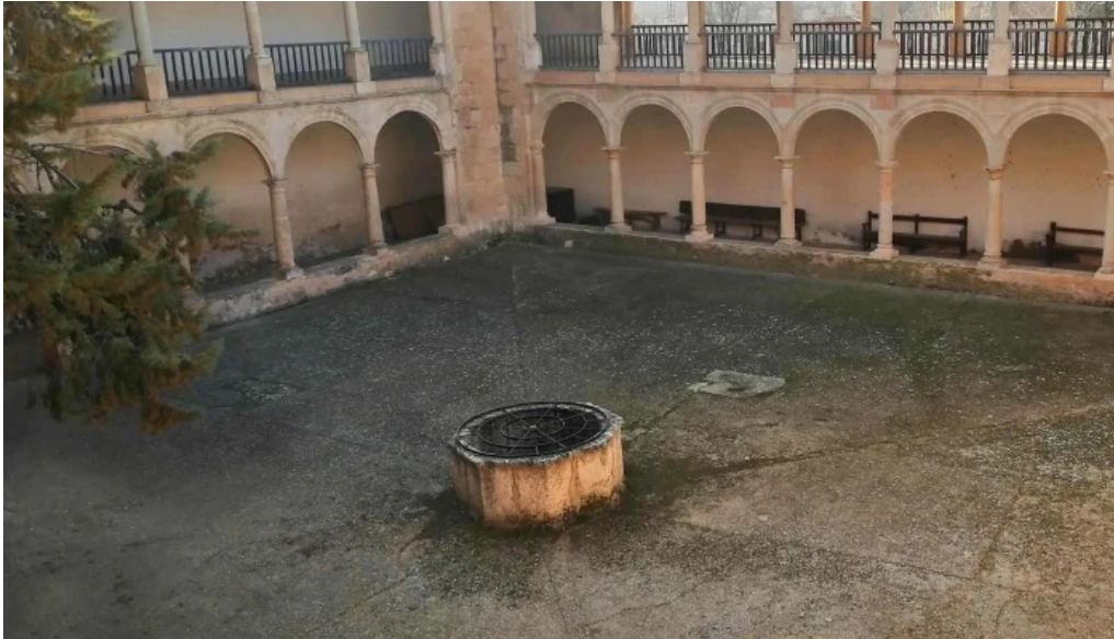
Santuario de ntra sra de los remedios abierto ahora