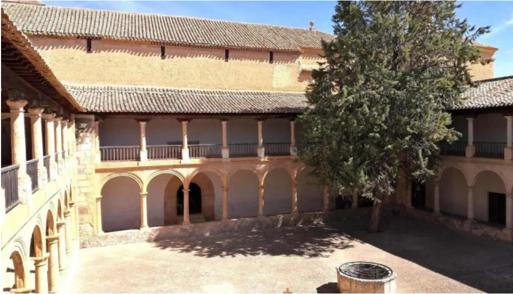
Santuario de ntra sra de los remedios santuario