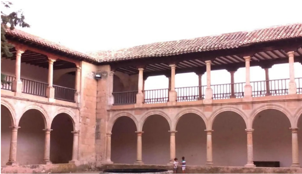
Santuario de ntra sra de los remedios fuensanta