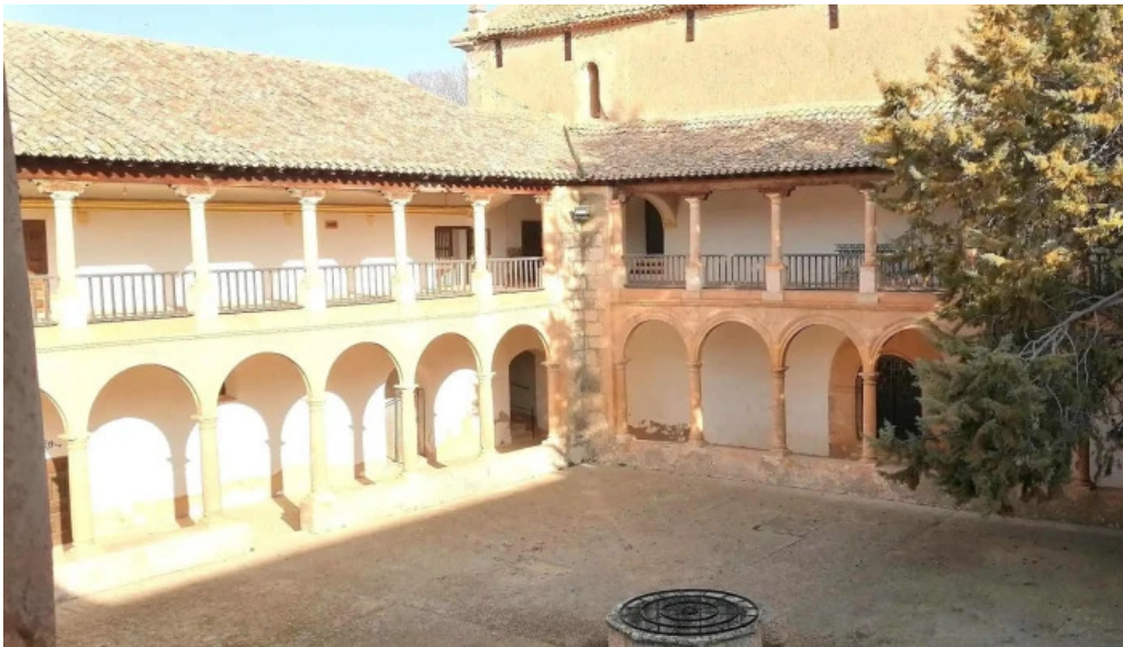
Santuario de ntra sra de los remedios direccion