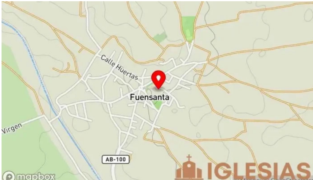
Santuario de ntra sra de los remedios mapa