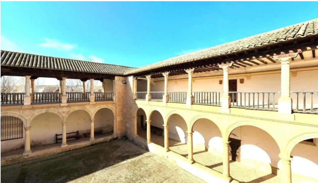
Santuario de ntra sra de los remedios paisaje