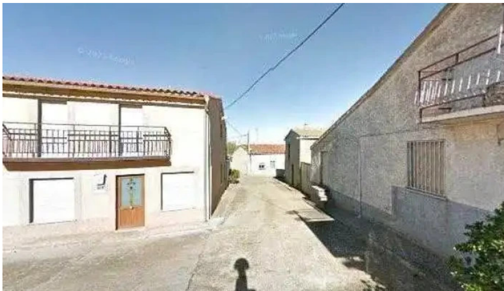
Iglesia parroquial de san pedro numero