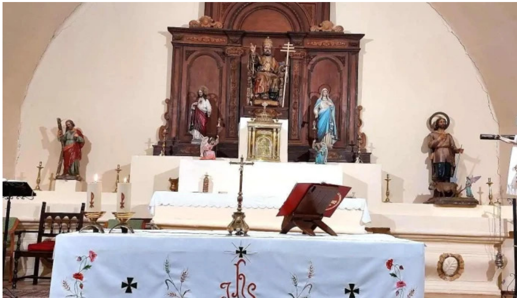
Iglesia parroquial de san pedro parroquia