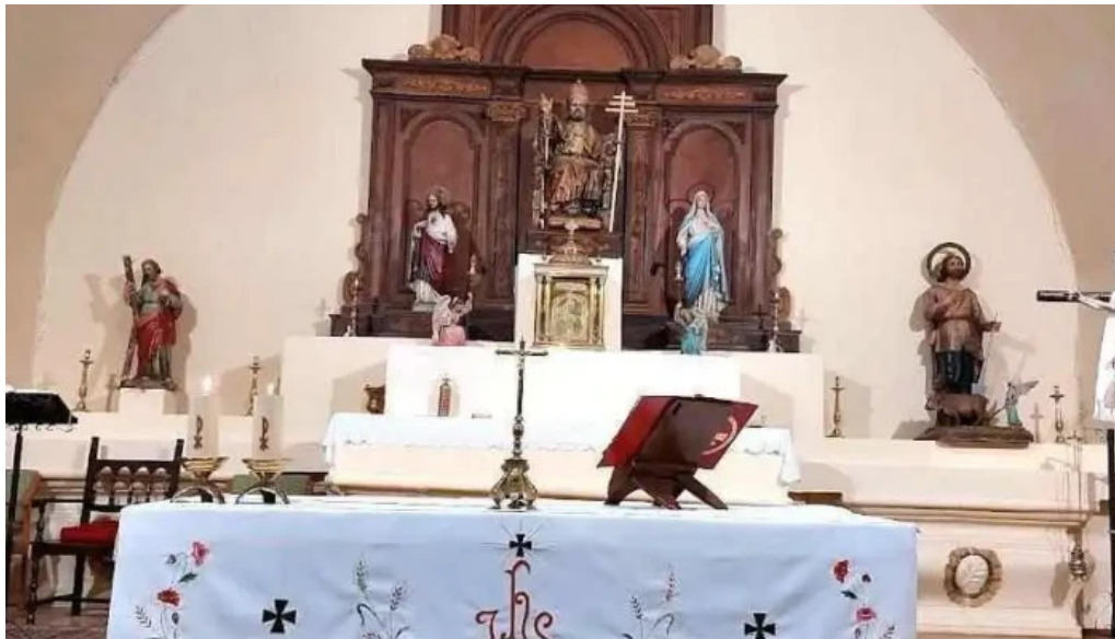
Iglesia parroquial de san pedro tardaguila