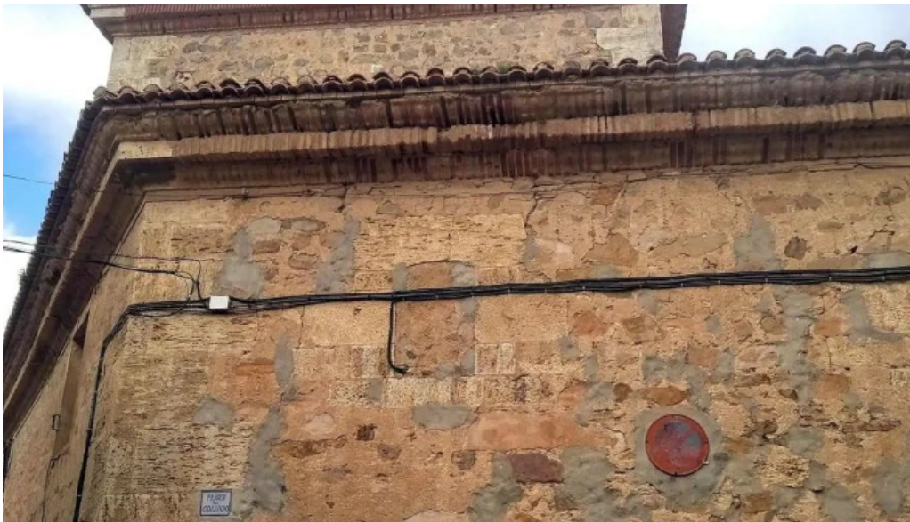
Iglesia parroquial de san agustin parroquia