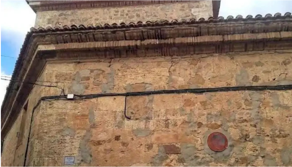
Iglesia parroquial de san agustin san agustin