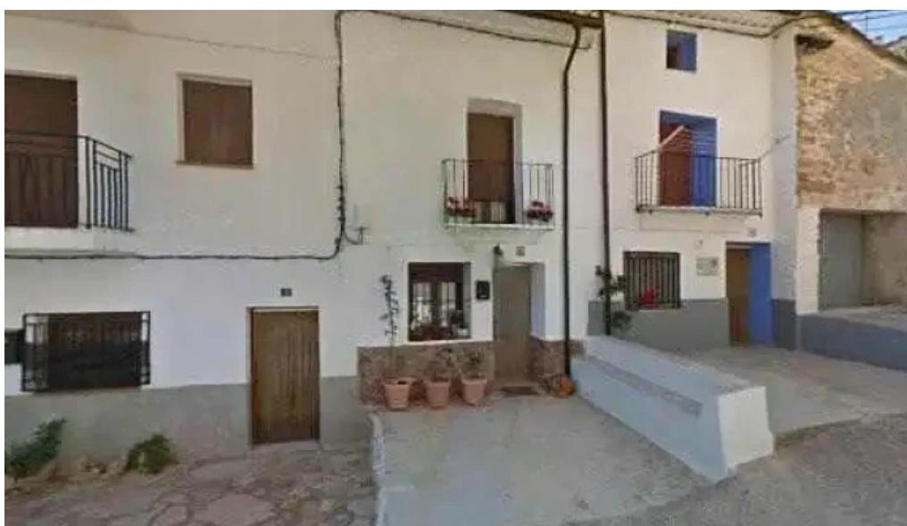
Iglesia parroquial de san agustin instagram