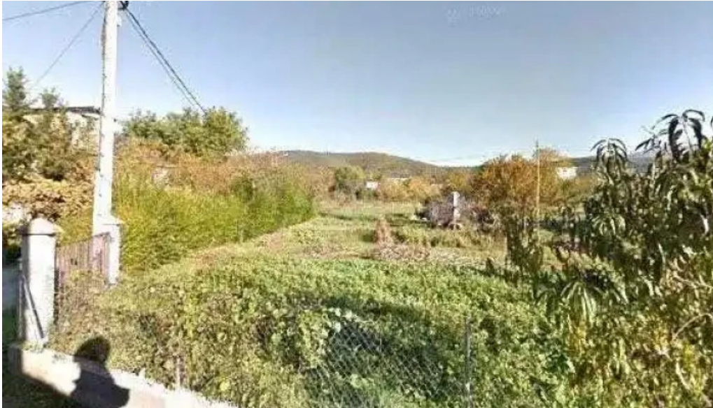
Parroquia catolica san andres apostol parroquia