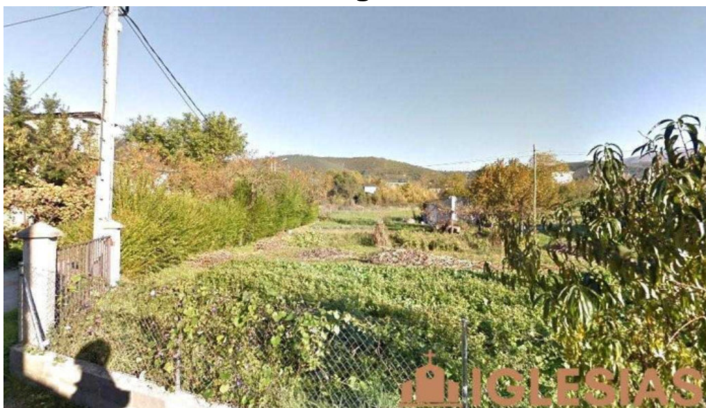
Parroquia catolica san andres apostol salas de la ribera