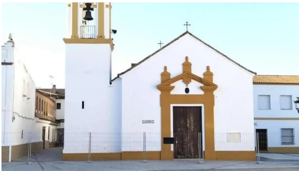
Parroquia de san bartolome parroquia