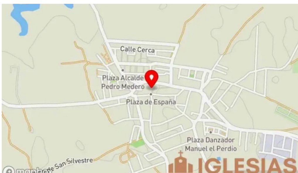
Parroquia de san bartolome mapa