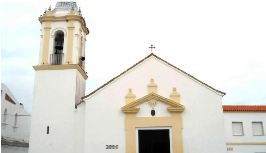
Parroquia de san bartolome s bartolome de la torre