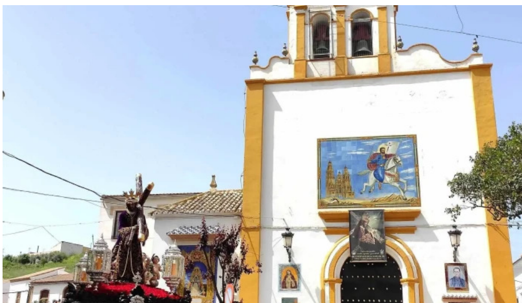
Parroquia de santiago el mayor parroquia