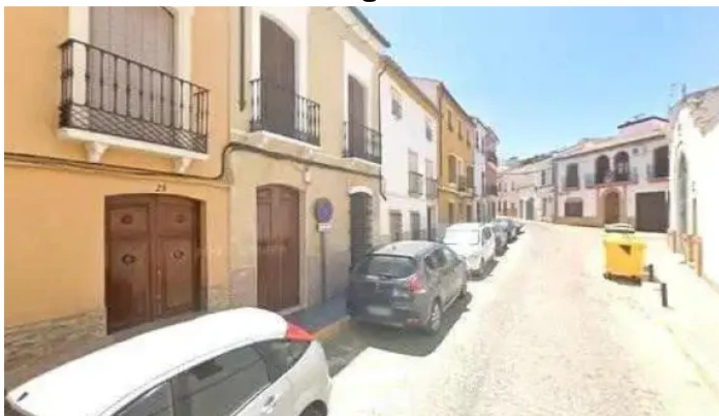
Parroquia de santiago el mayor santiago