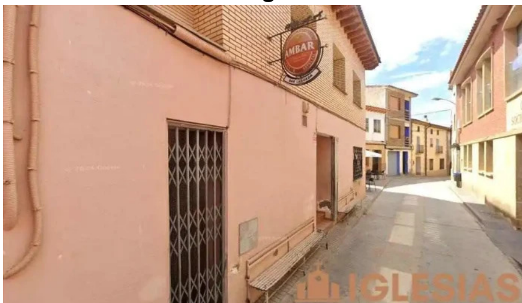
Parroquia de la asuncion de nuestra senora peralta de alcofea