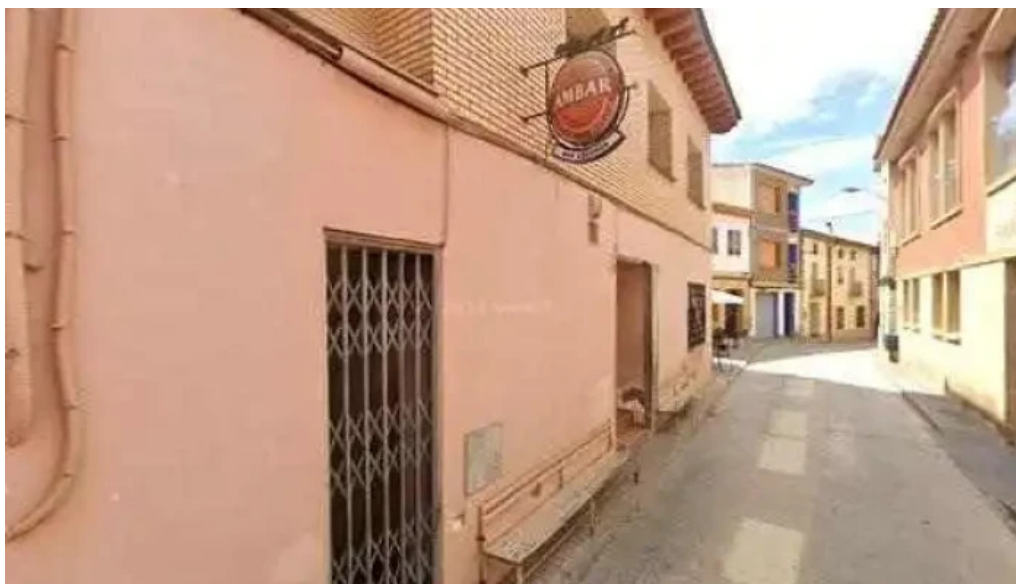
Parroquia de la asuncion de nuestra senora parroquia