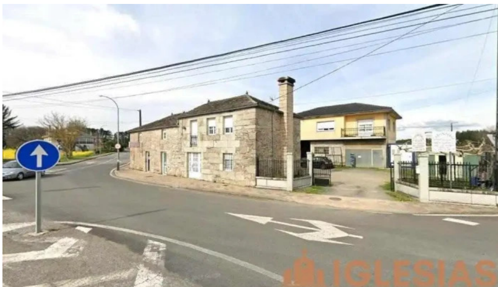
Parroquia católica san juan o corgo