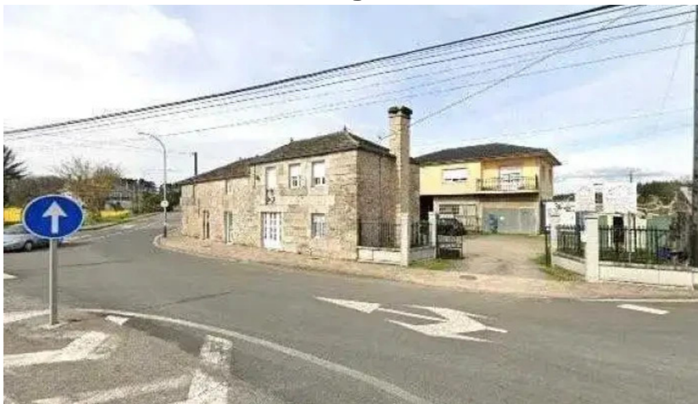
Parroquia catolica san juan parroquia