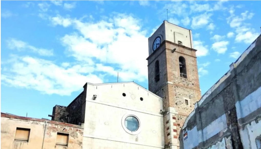
Sant pere apostol montbrio del camp