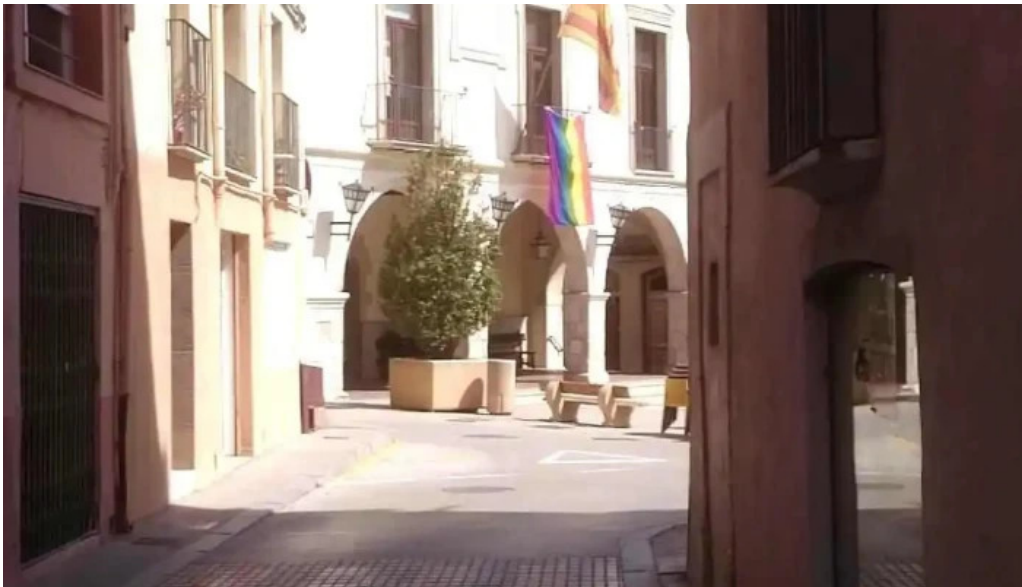
Sant pere apostol videos