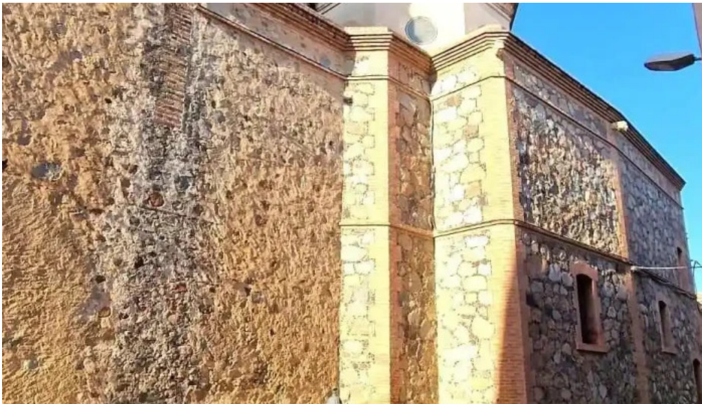
Sant pere apostol parroquia