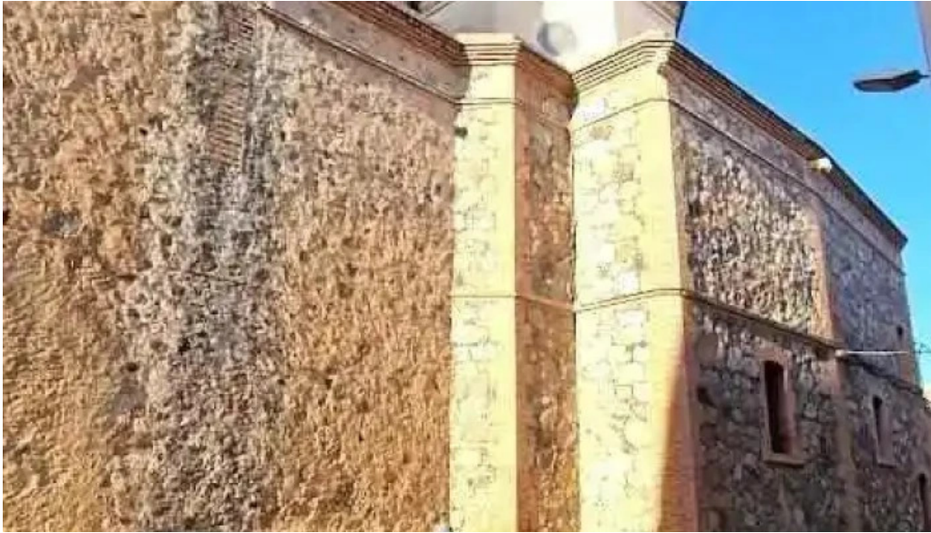
Sant pere apòstol montbrio del camp