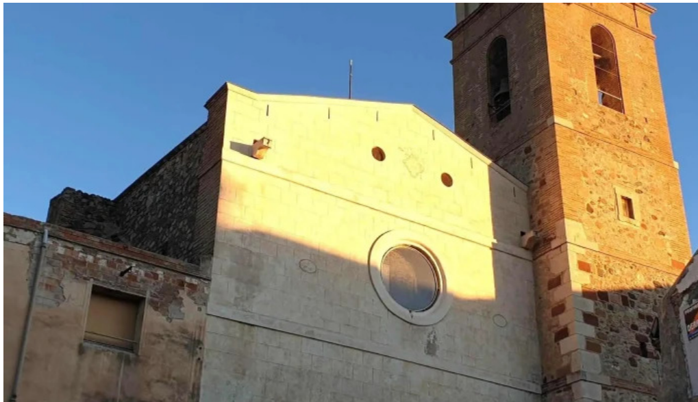
Sant pere apostol direccion