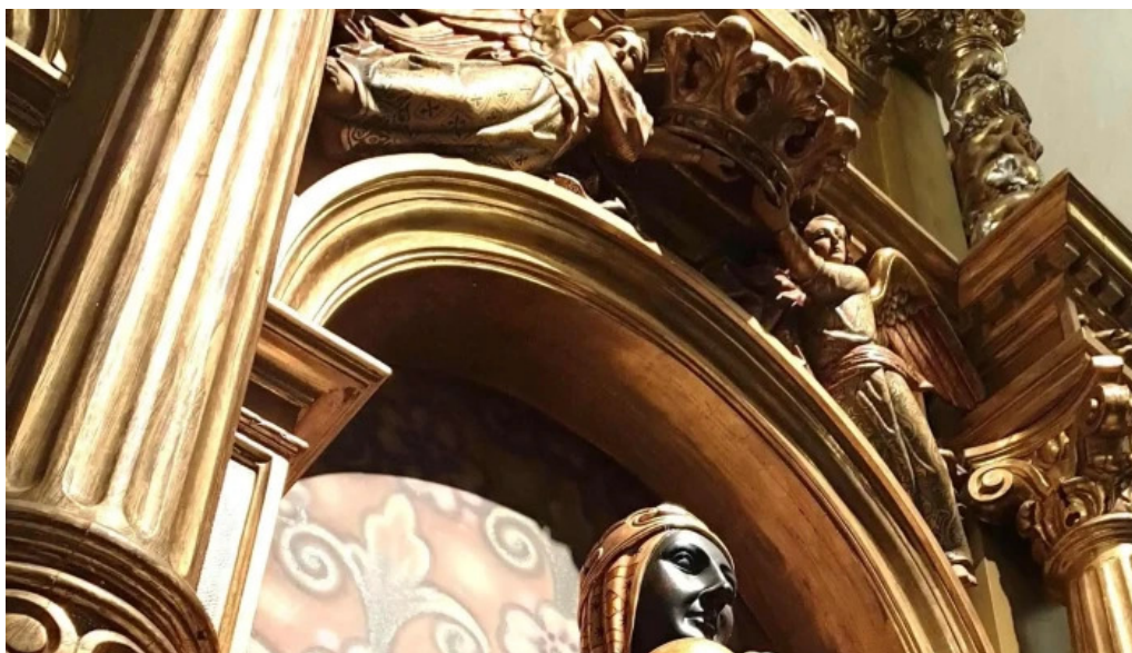
Sant pere apostol como llegar