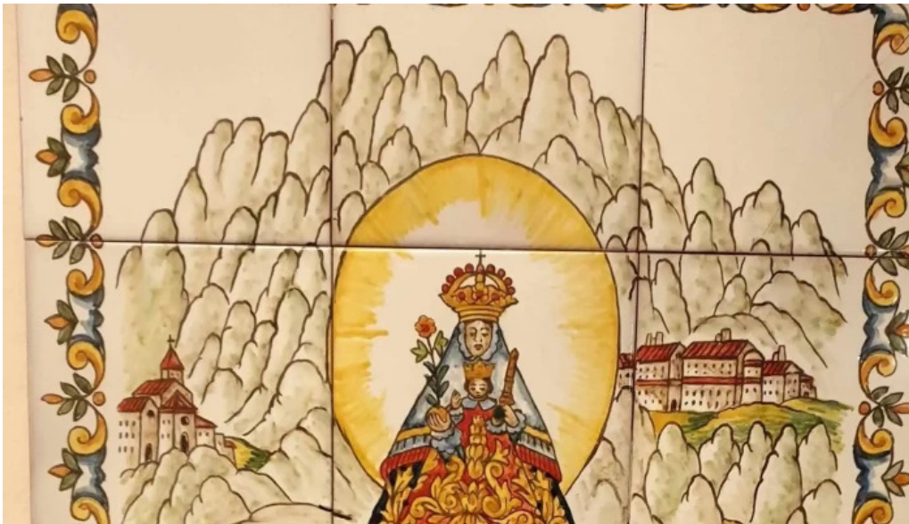
Sant pere apostol promocion