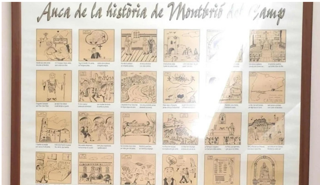
Sant pere apostol fotos