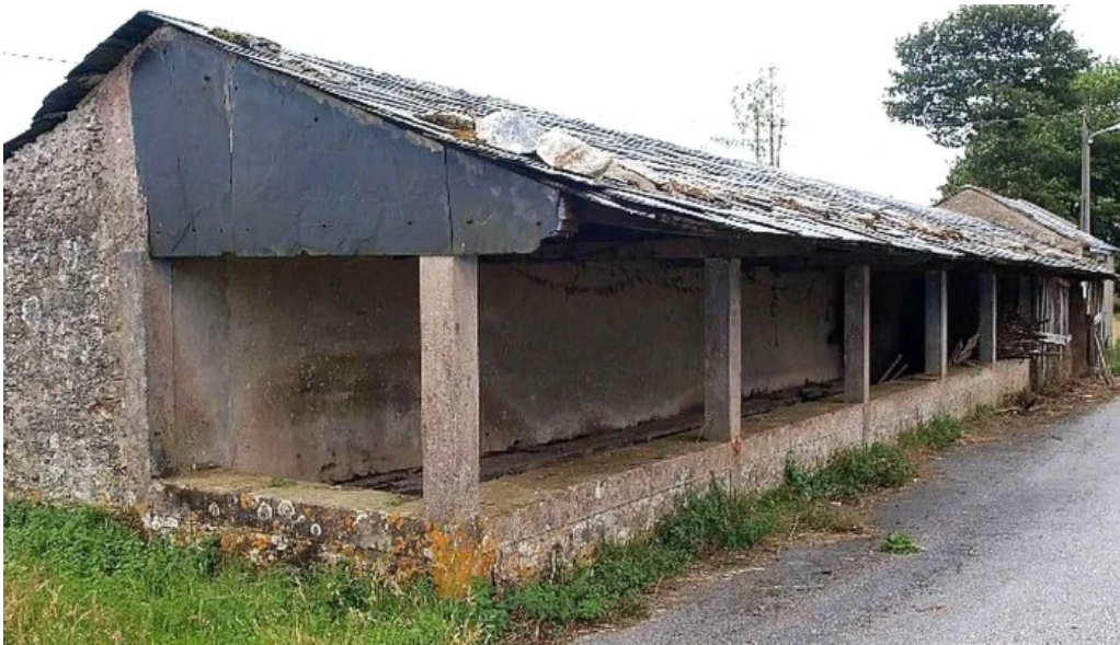
Parroquial de sa ma de manon videos