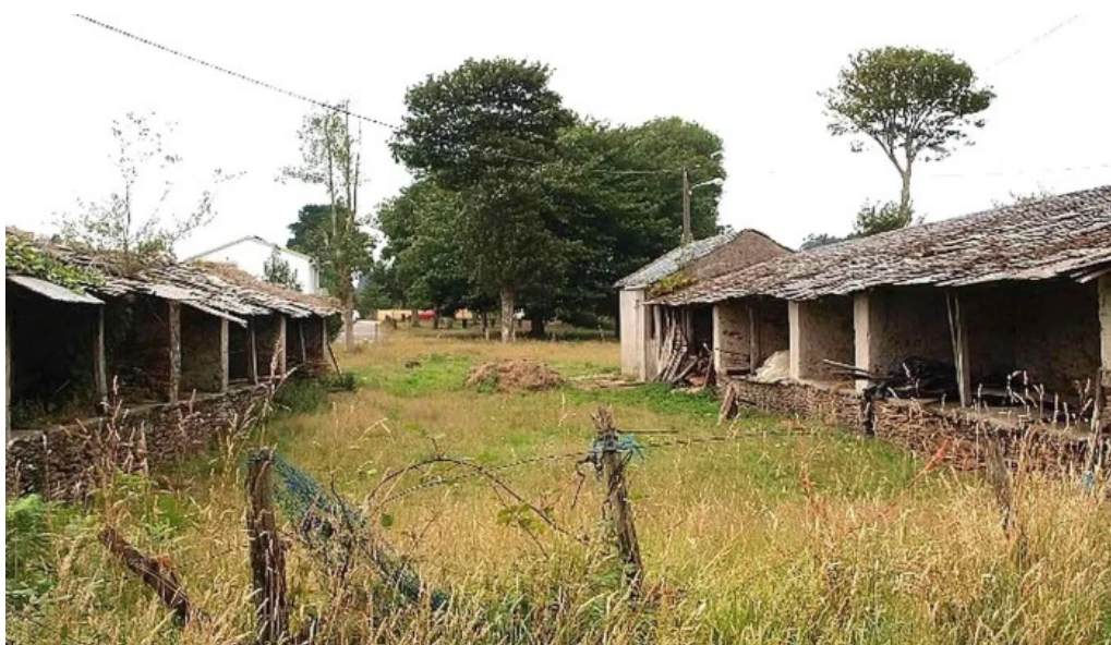
Parroquial de sa ma de manon manon