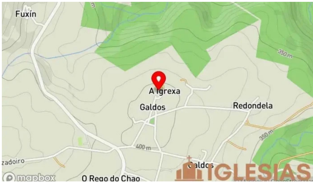
Parroquia de sa ma de manon mapa