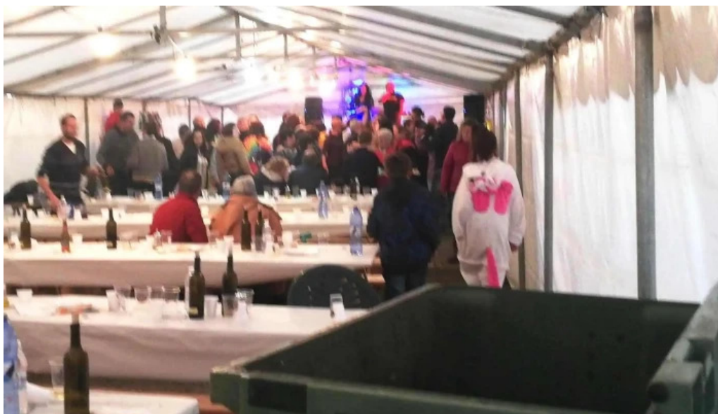
Parroquial de sa ma de manon comentarios