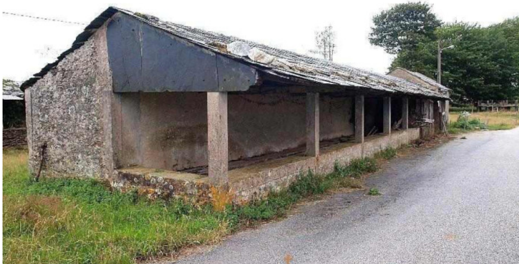
Parroquia de sa ma de manon parroquia