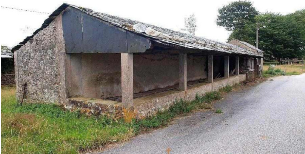
Parroquial de s a m a de manon manon