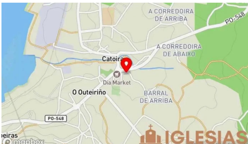
Parroquia catolica san miguel mapa