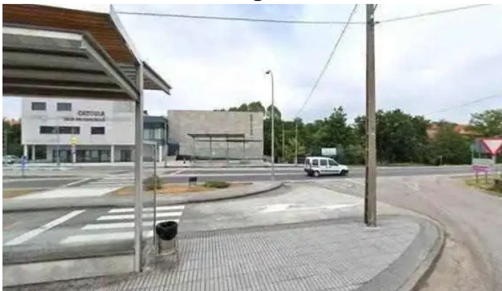
Parroquia catolica san miguel parroquia