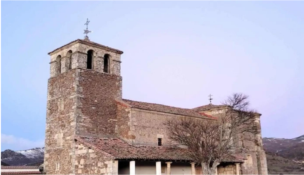
Iglesia de san vicente martir parroquia