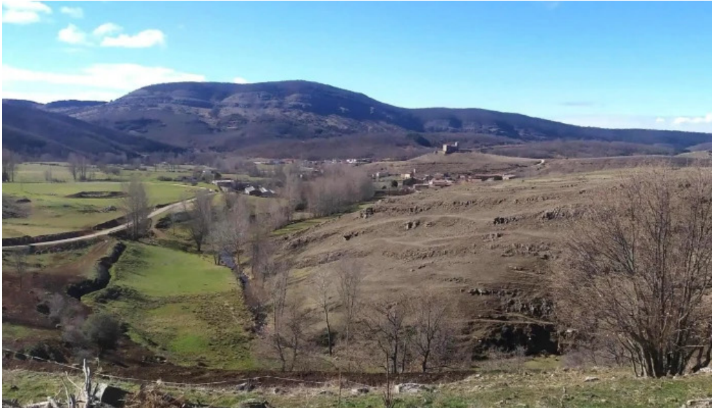
Iglesia de san vicente martir bonar