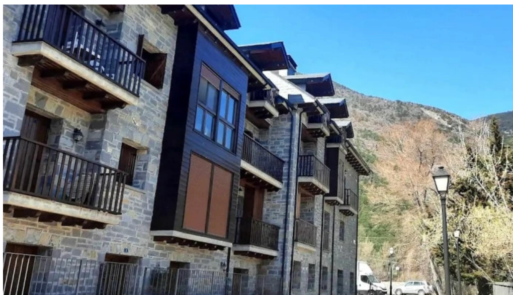
Iglesia de san pedro apostol telefono