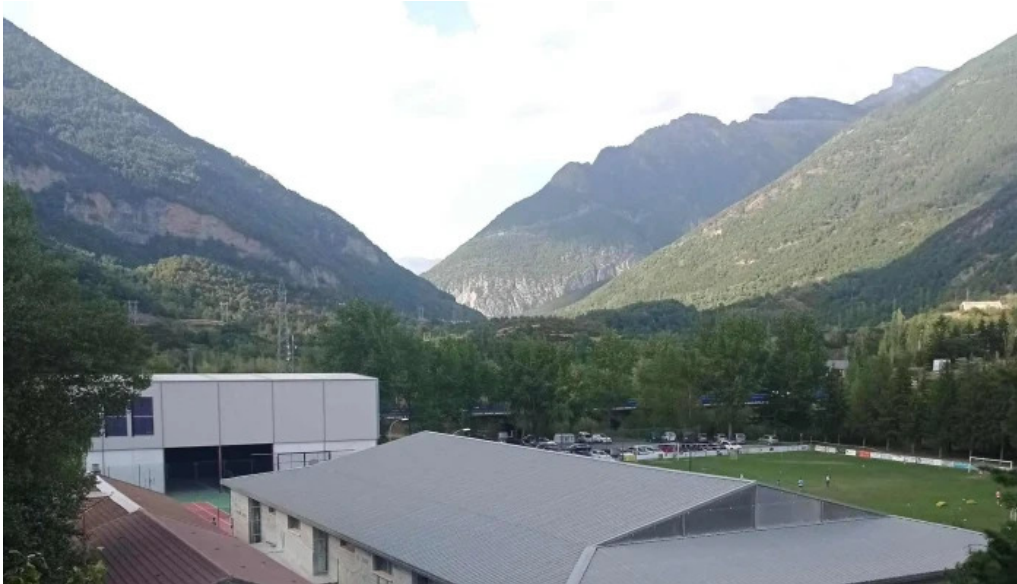
Iglesia de san pedro apostol catalogo