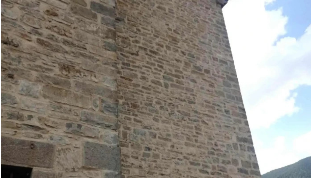
Iglesia de san pedro apostol puntaje