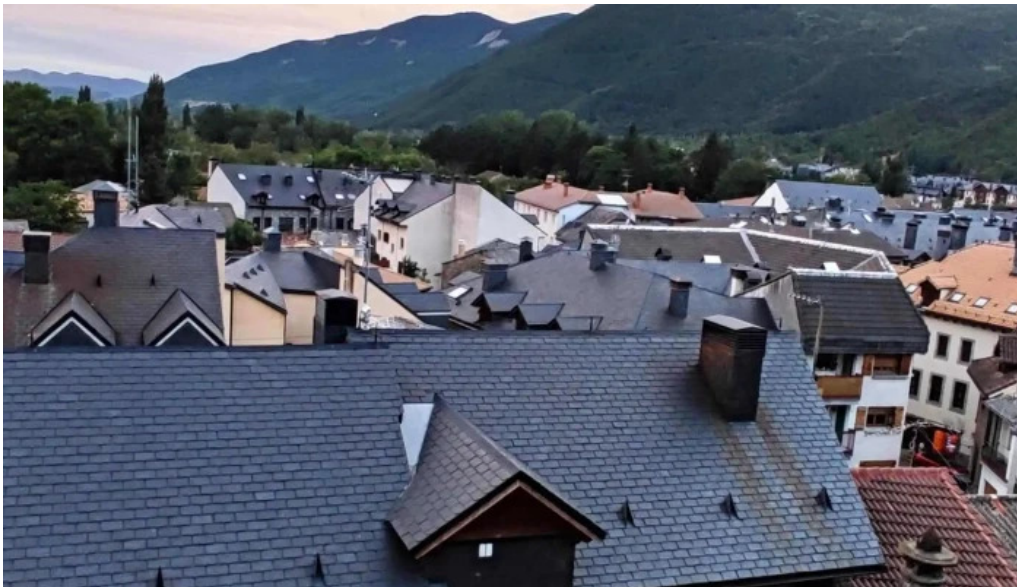
Iglesia de san pedro apostol biescas