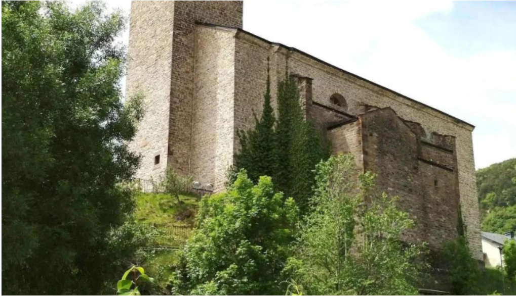
Iglesia de san pedro apostol parroquia