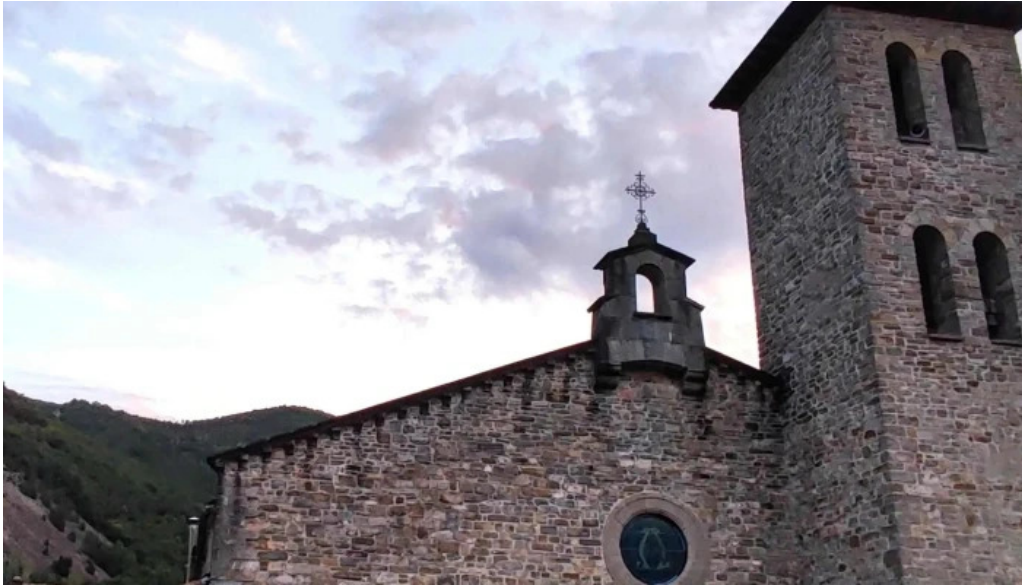
Iglesia de san pedro apostol direccion