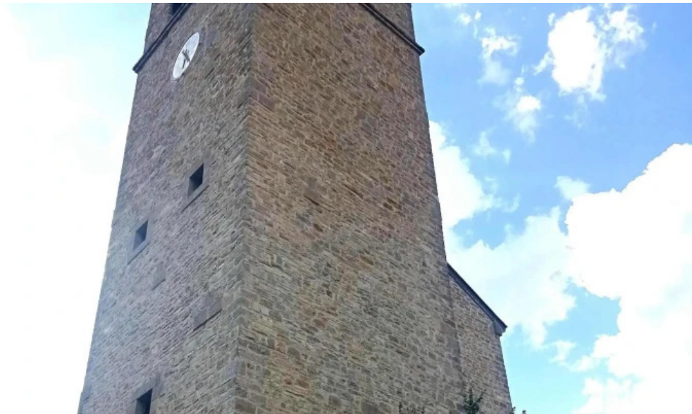
Iglesia de san pedro apostol fotos