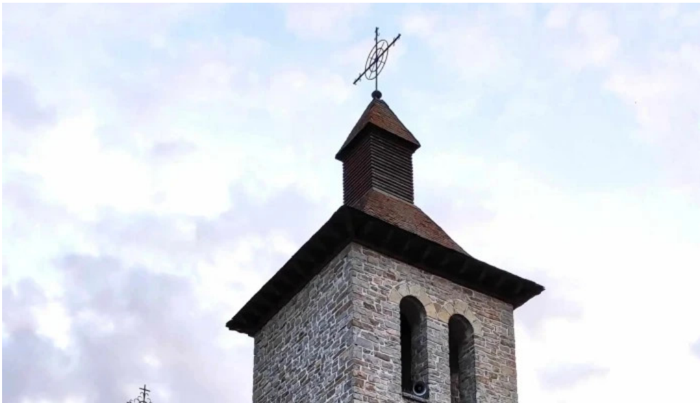
Iglesia de san pedro apostol precios