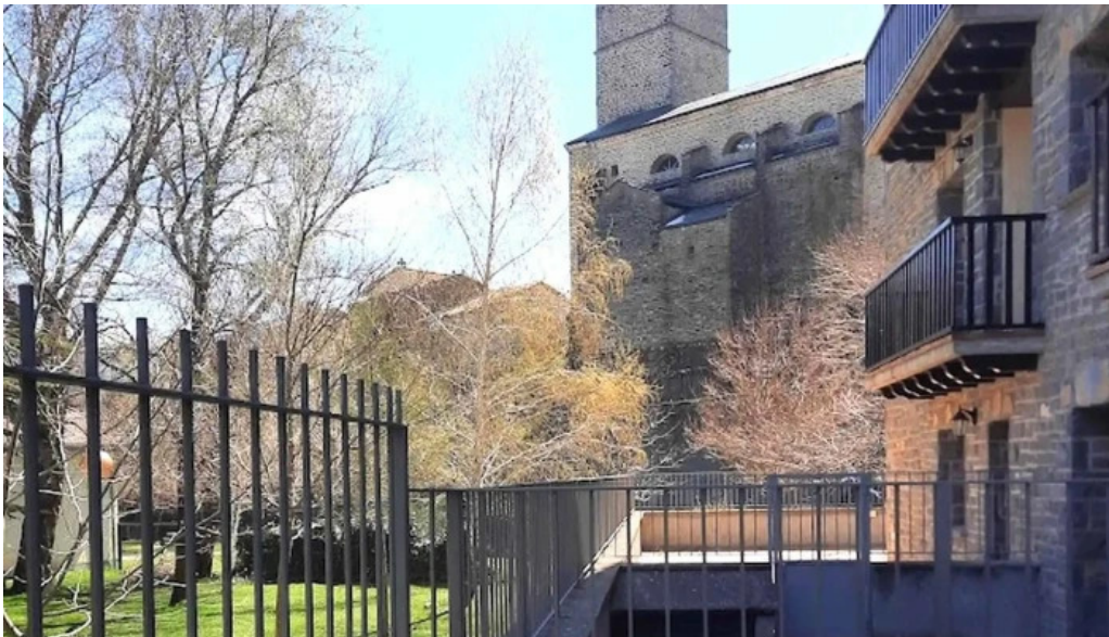
Iglesia de san pedro apostol descuentos