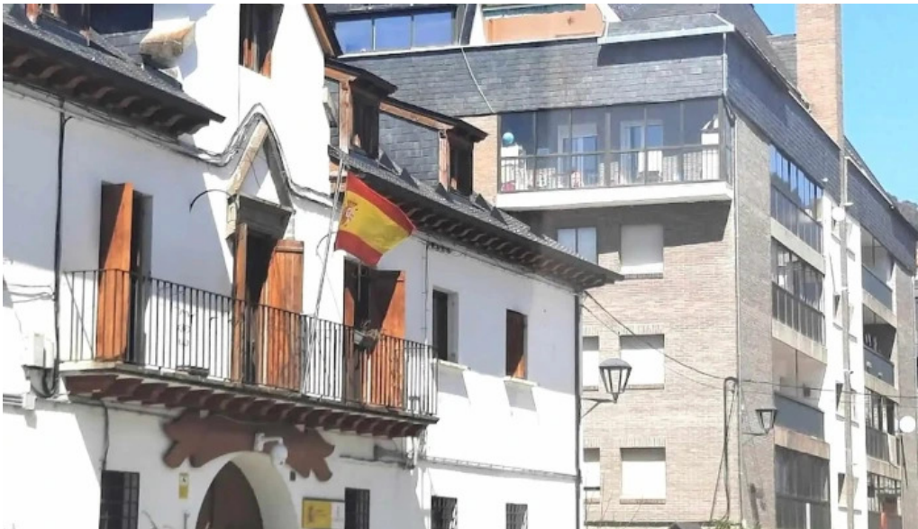
Iglesia de san pedro apostol donde