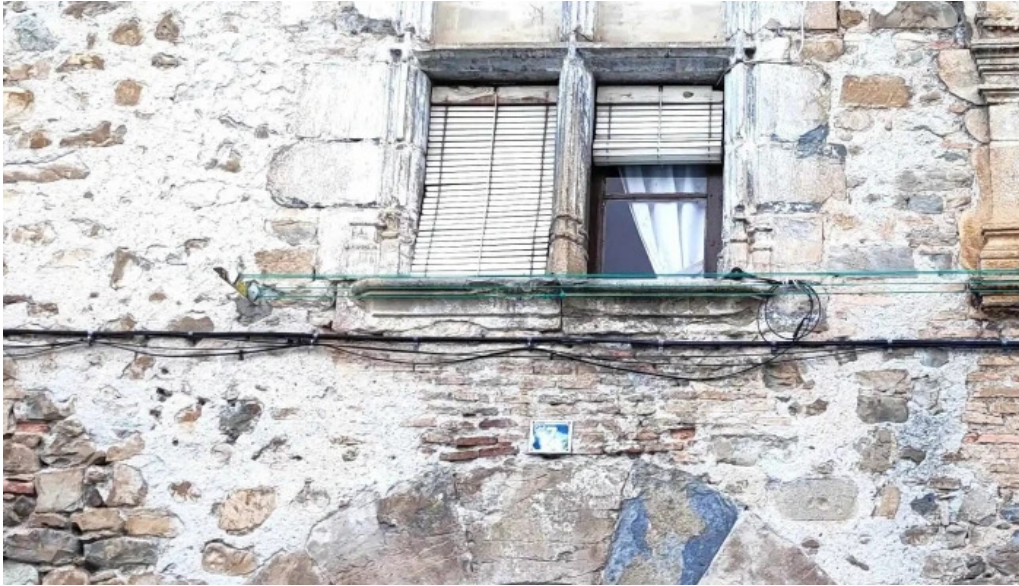
Iglesia de san pedro apostol instagram