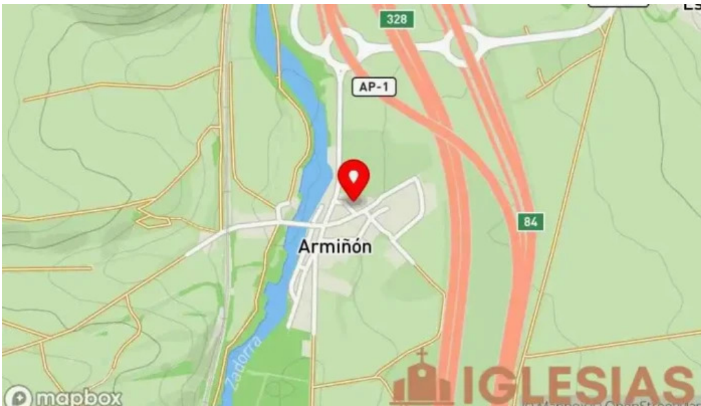
Iglesia parroquial de san andres mapa