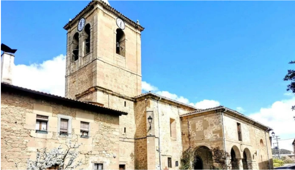
Iglesia parroquial de san andres parroquia