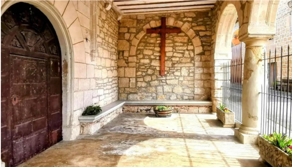
Iglesia parroquial de san andres arminon