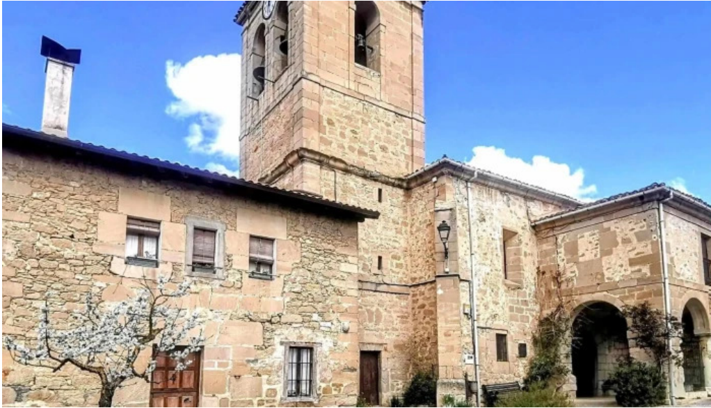
Iglesia parroquial de san andres direccion