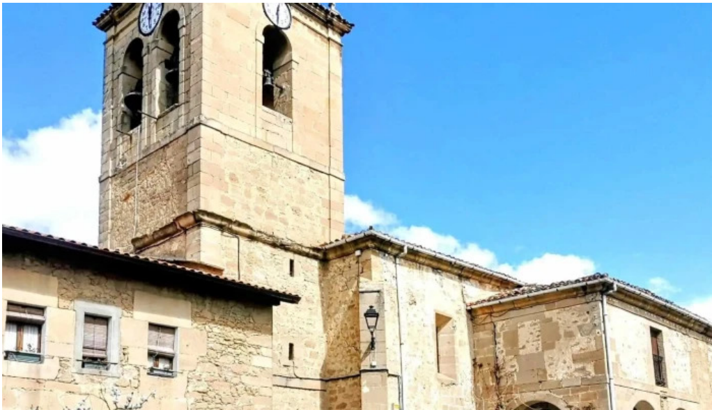
Iglesia parroquial de san andres catalogo