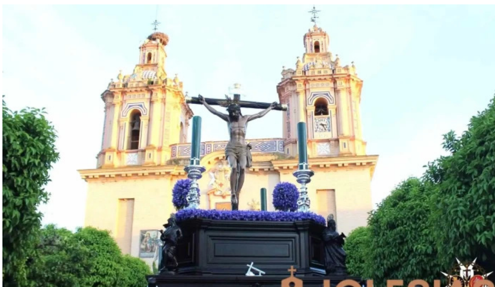
Hermandad de la vera cruz de tocina organizacion religiosa