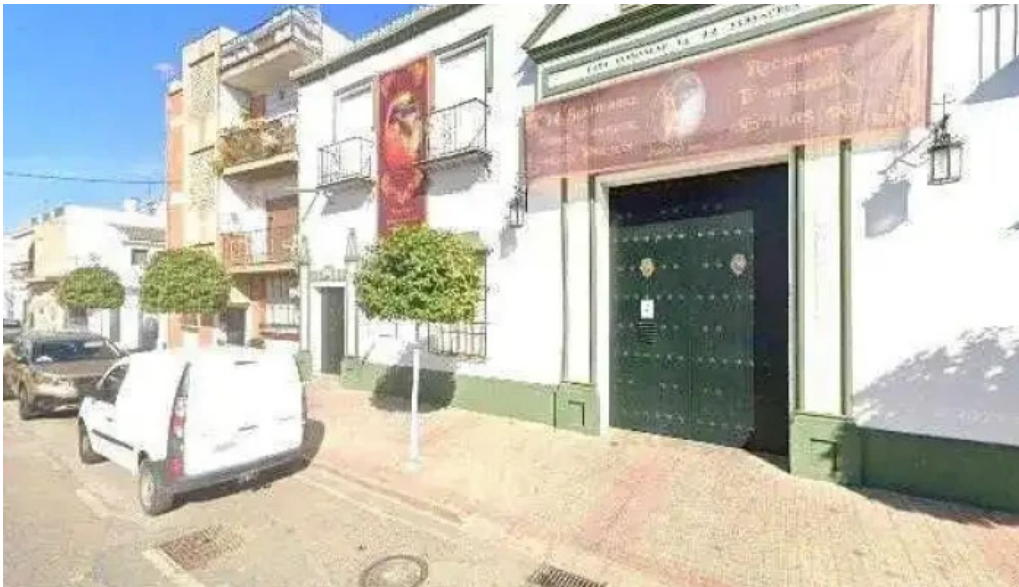
Hermandad de la vera cruz de tocina instagram