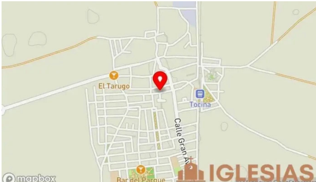
Hermandad de la vera cruz de tocina mapa