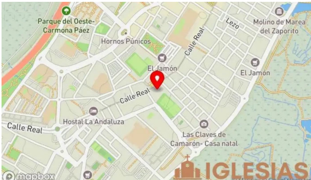
Venerable real muy ilustre y primitiva archicofradia sacramental de nuestra senora del carmen coronada mapa