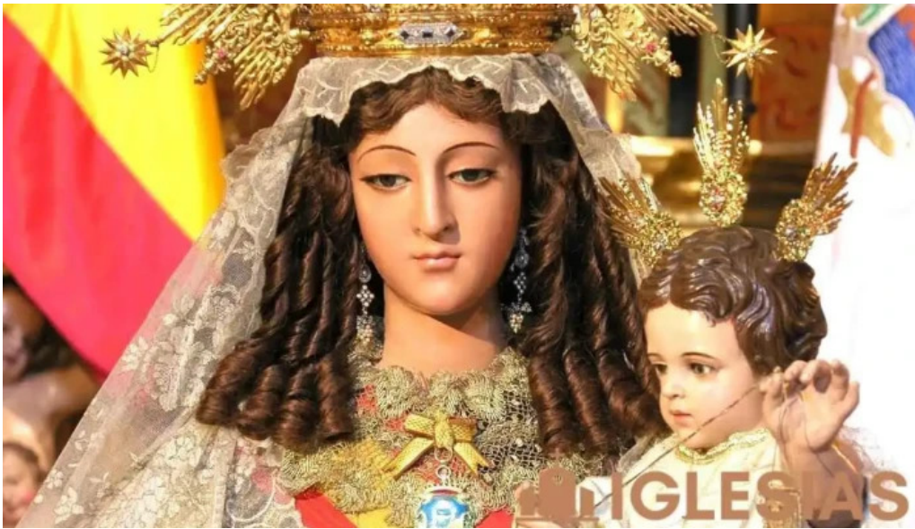
nerable real muy ilustre y primitiva archicofradia sacramental de nuestra senora del carmen coronada del propiet