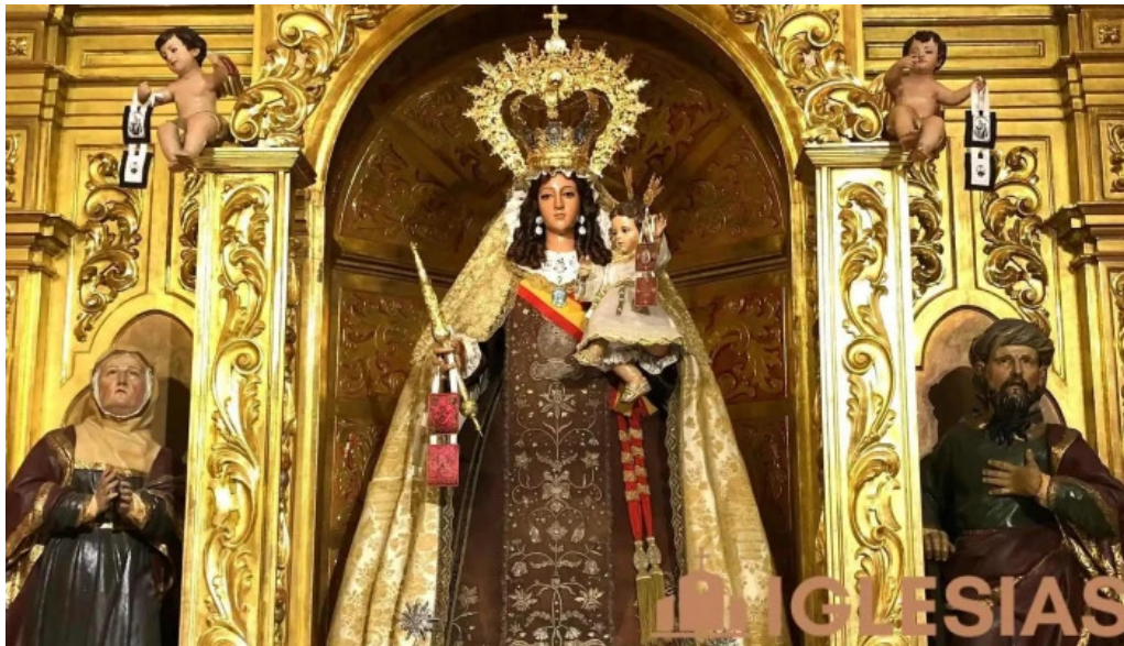
Venerable real muy ilustre y primitiva archicofradia sacramental de nuestra senora del carmen coronada san fernan