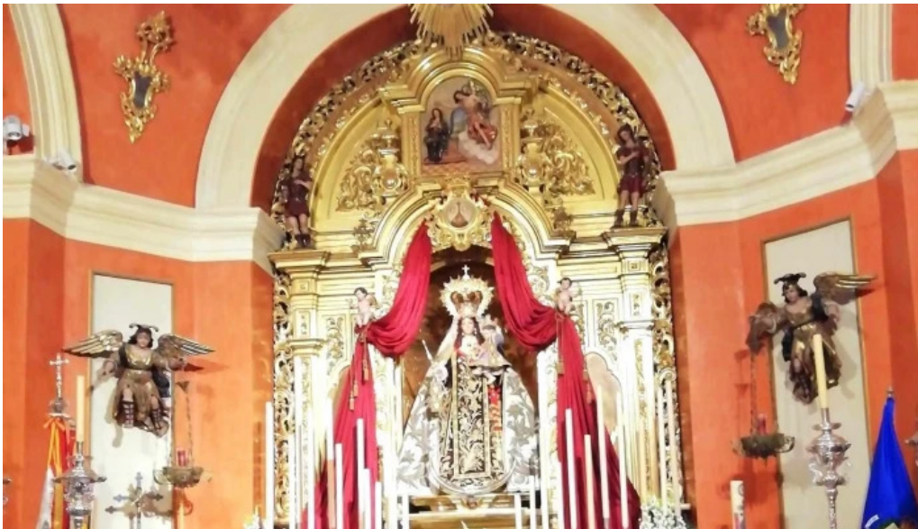
nerable real muy ilustre y primitiva archicofradia sacramental de nuestra senora del carmen coronada comentari