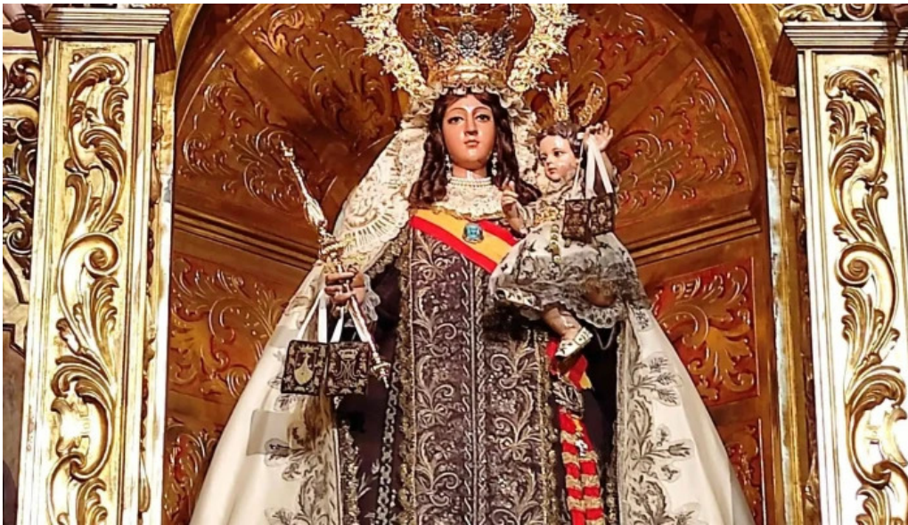
nerable real muy ilustre y primitiva archicofradia sacramental de nuestra senora del carmen coronada comentari