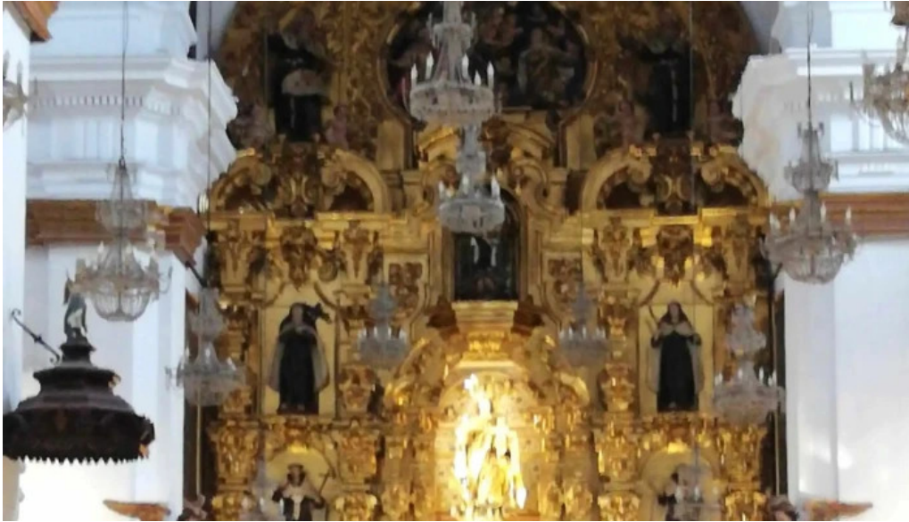
nerable real muy ilustre y primitiva archicofradia sacramental de nuestra senora del carmen coronada comentari