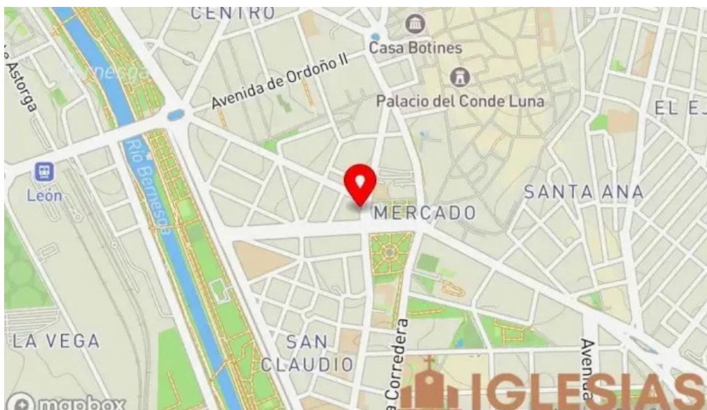
Cofradía del dulce nombre de Jesús Nazareno mapa