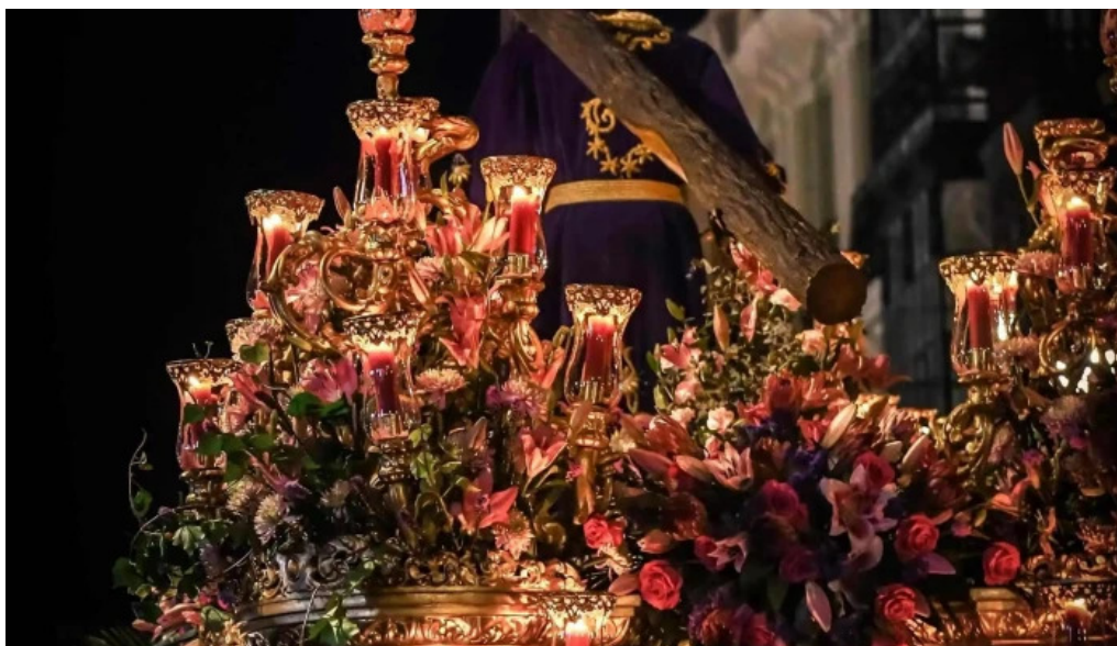
Cofradía del dulce nombre de Jesús Nazareno león