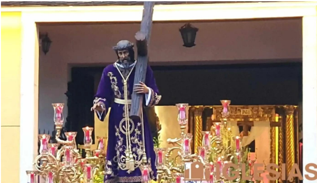
Cofradia del dulce nombre de jesus nazareno videos