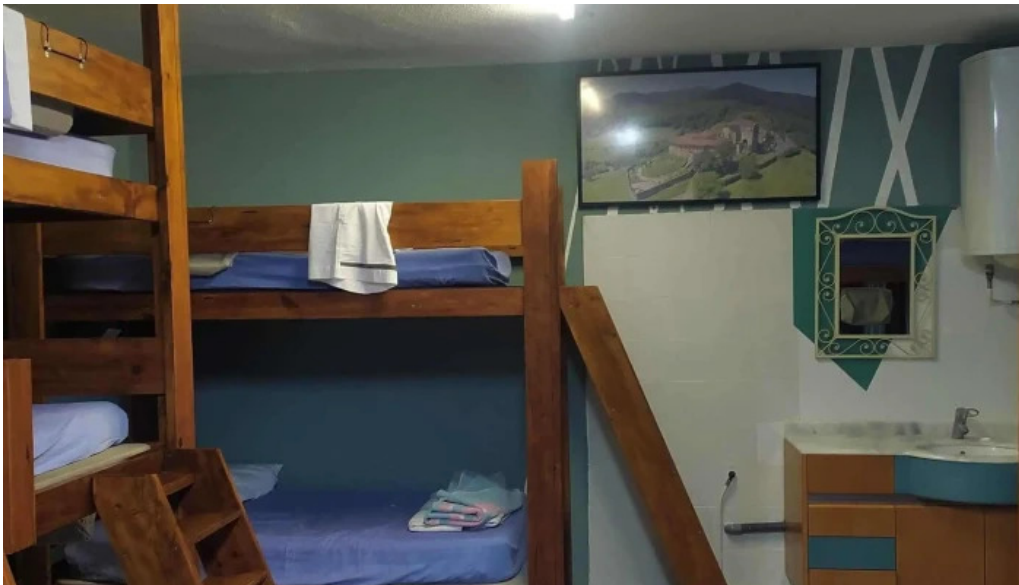
Monasterio de santa maria de zenarruza ziertza bolibar