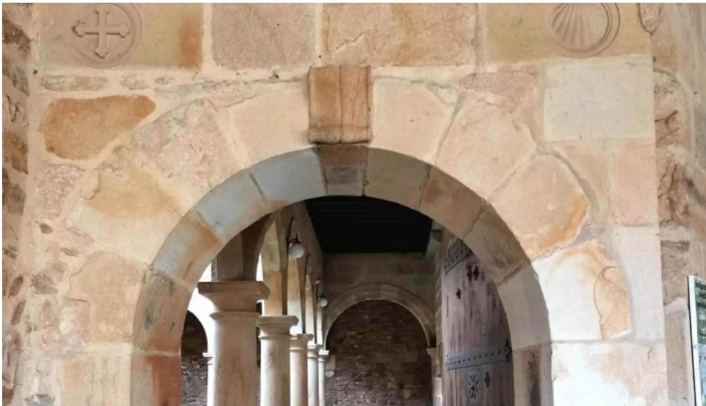
Monasterio de santa maria de zenarruza catalogo