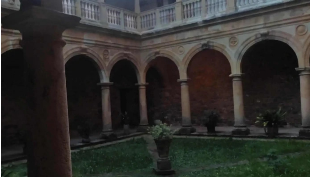
Monasterio de santa maria de zenarruza como llegar