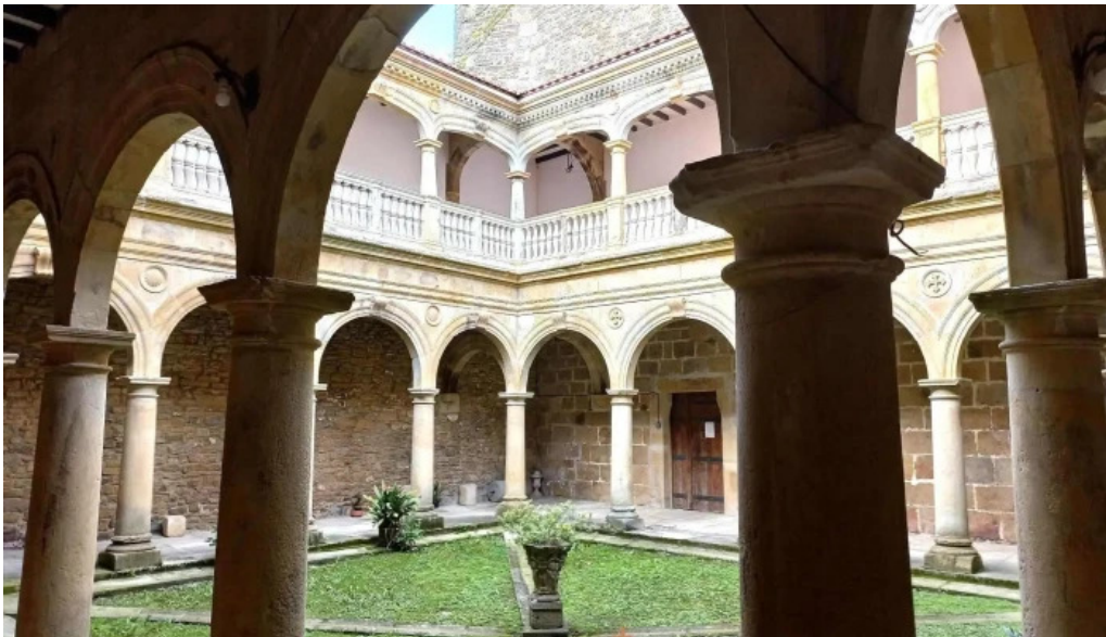
Monasterio de santa maria de zenarruza monasterio