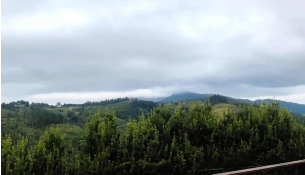
Monasterio de santa maria de zenarruza videos