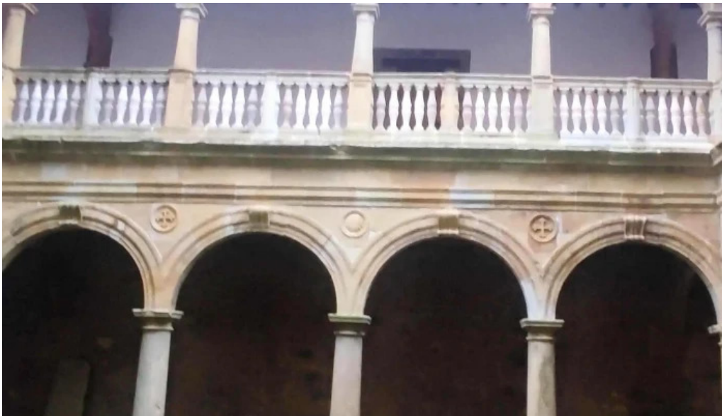
Monasterio de santa maria de zenarruza horario