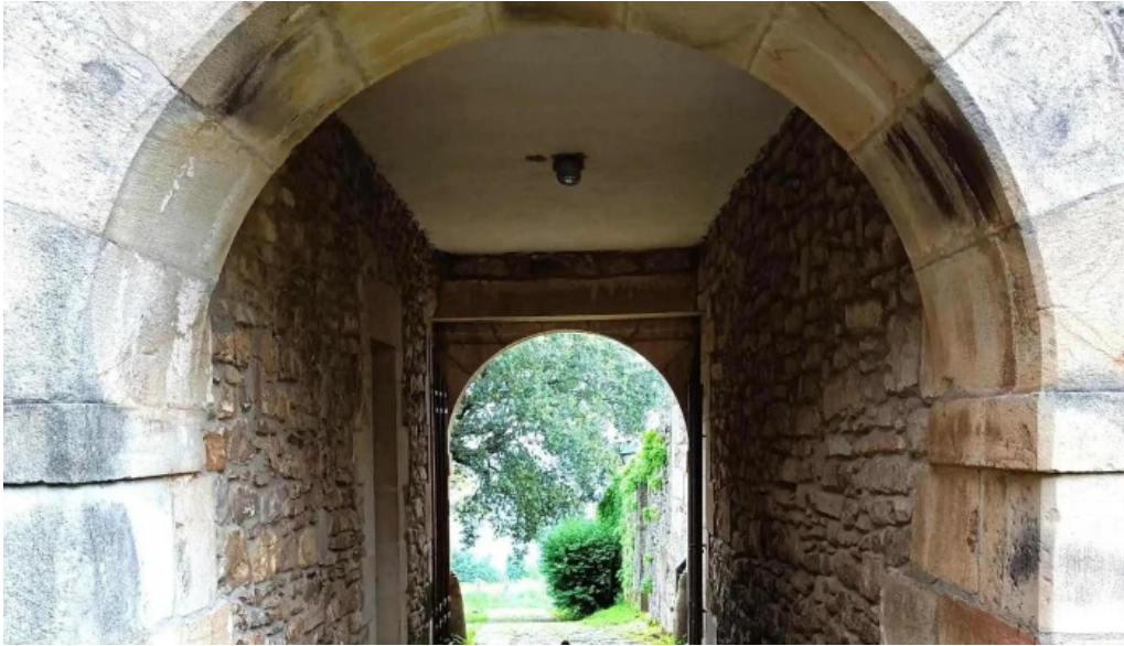
Monasterio de santa maria de zenarruza zona