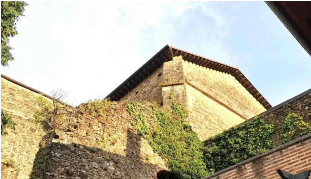
Monasterio de santa maria de zenarruza precios