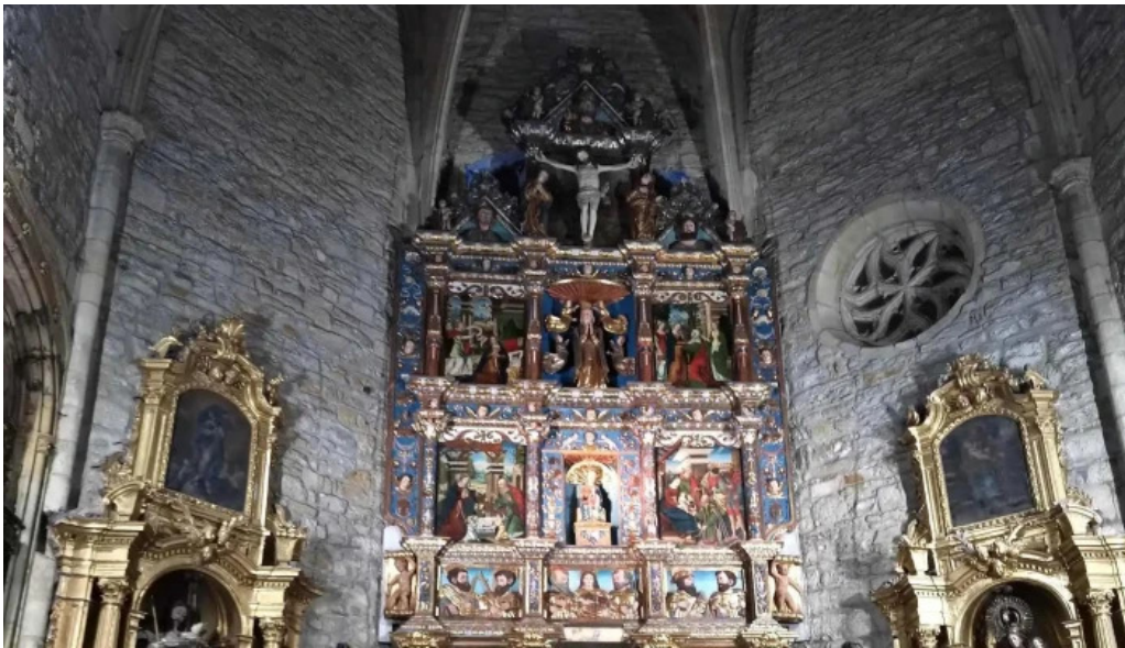
Monasterio de santa maria de zenarruza telefono