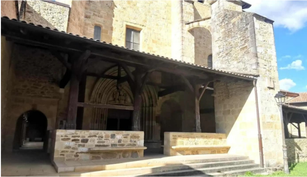
Monasterio de santa maria de zenarruza puntaje