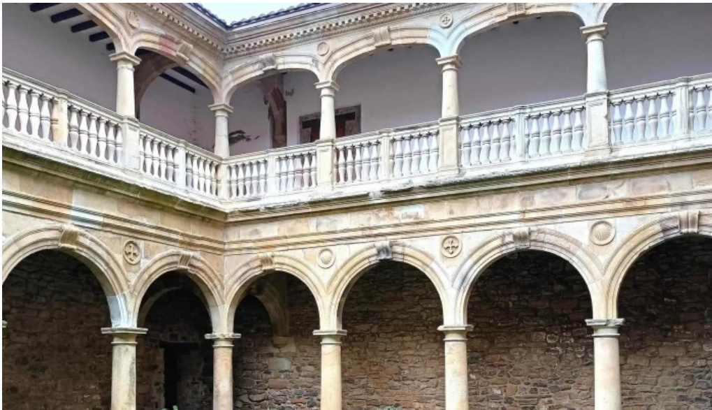
Monasterio de santa maria de zenarruza descuentos