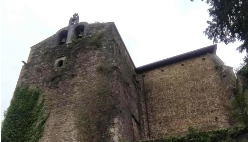
Monasterio de santa maria de zenarruza opiniones