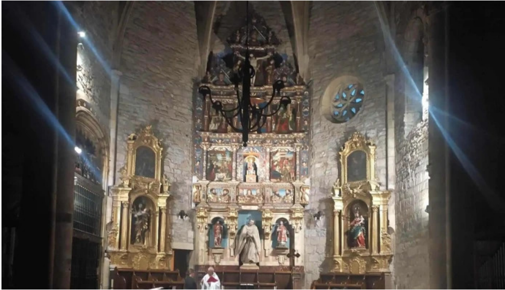
Monasterio de santa maria de zenarruza direccion