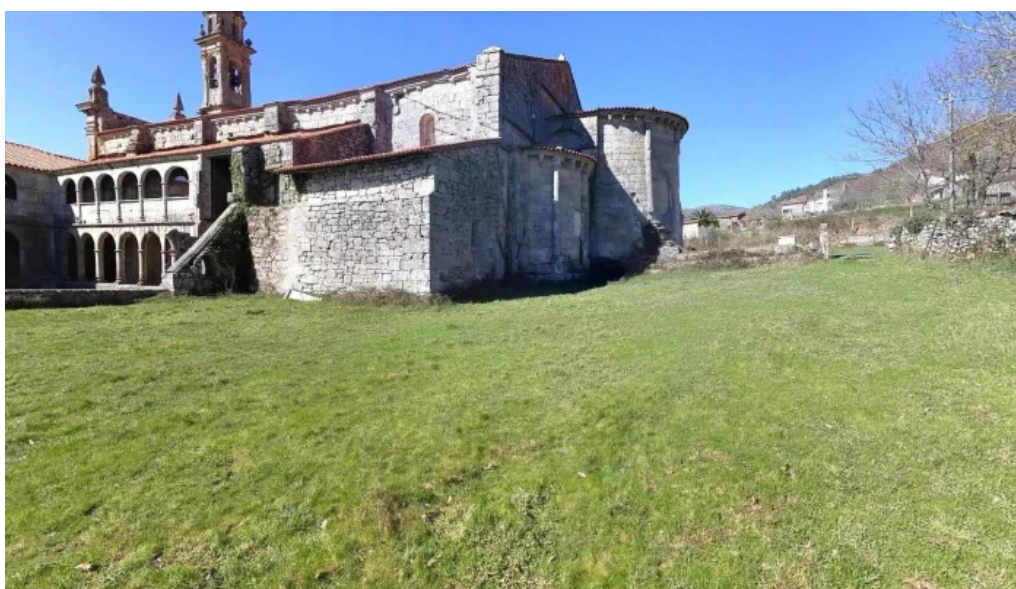
Monasterio cisterciense de santa maria de xunqueira de espadanedo comentarios