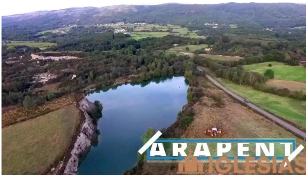
Monasterio cisterciense de santa maria de xunqueira de espadanedo del propietario