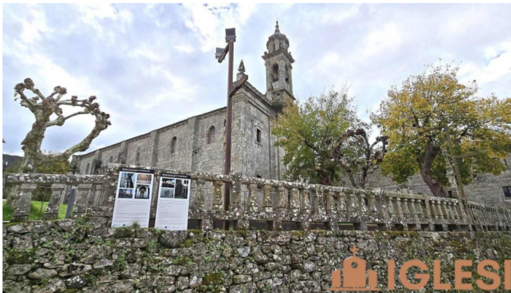
Monasterio cisterciense de santa maria de xunqueira de espadanedo recientes