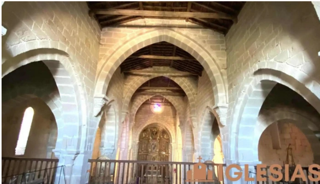
Monasterio cisterciense de santa maria de xunqueira de espadanedo xunqueira de espadanedo