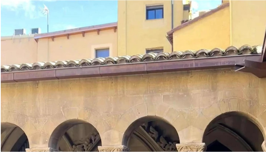
Monasterio de san pedro el viejo comentario 5