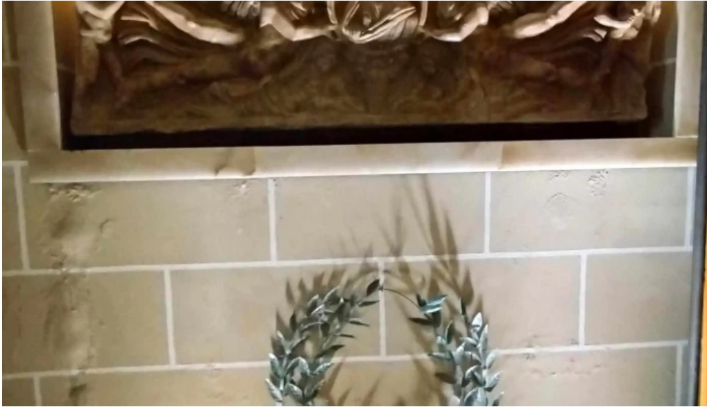
Monasterio de san pedro el viejo comentario 3