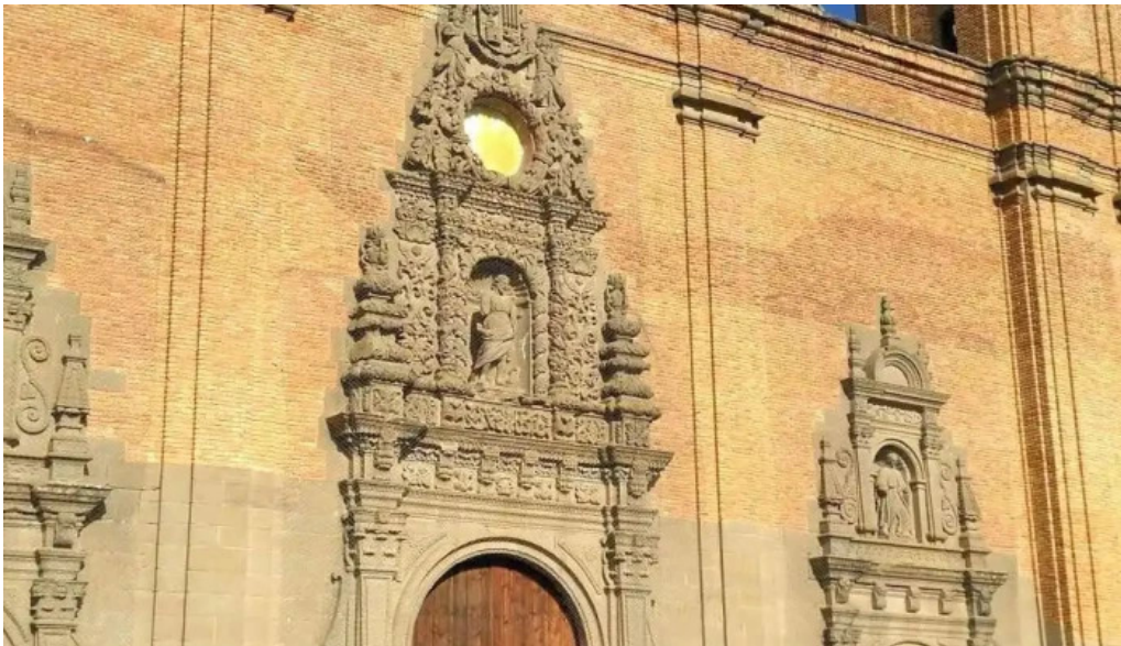
Monasterio de san pedro el viejo centro de interpretacion del reino de aragon