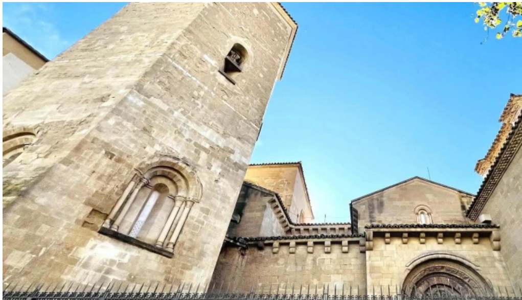
Monasterio de san pedro el viejo comentario 6