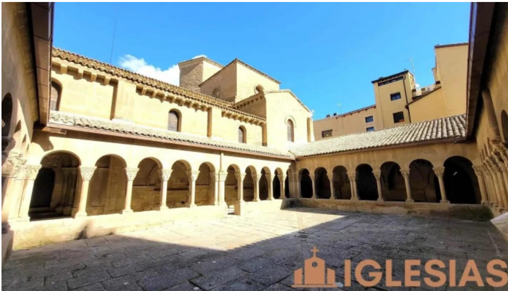
Monasterio de san pedro el viejo huesca