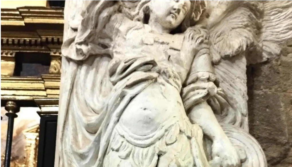
Monasterio de san pedro el viejo comentario 1