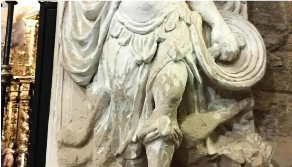
Monasterio de san pedro el viejo recientes