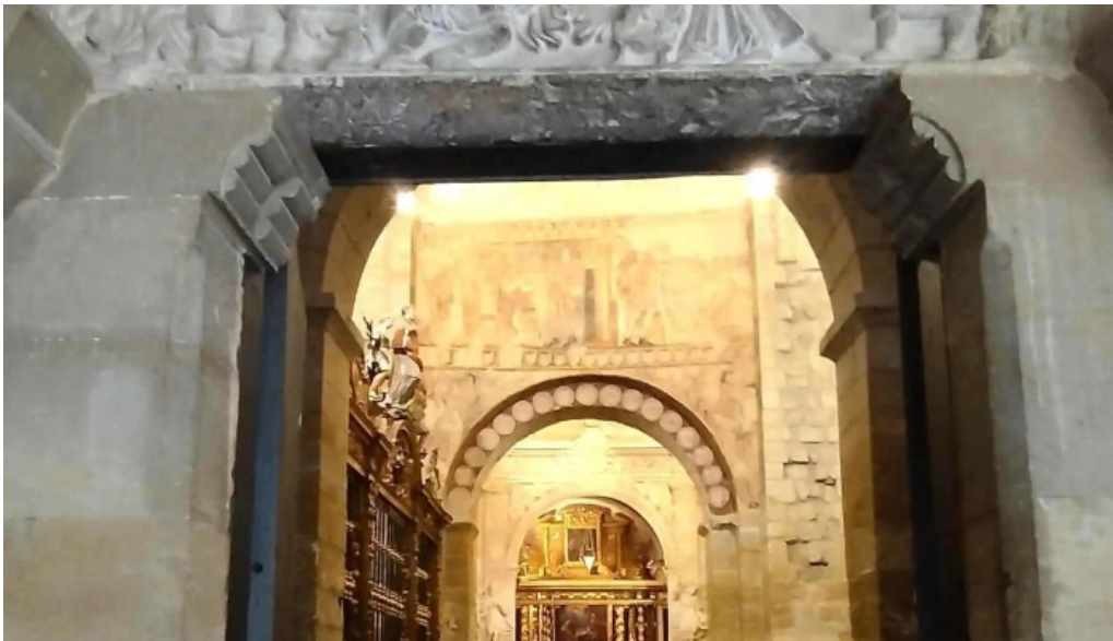
Monasterio de san pedro el viejo comentario 2