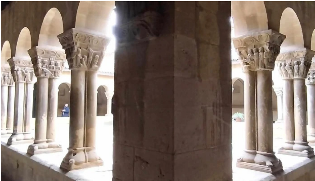
Monasterio de san pedro el viejo comentario 4