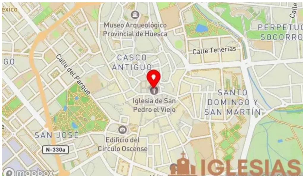
Monasterio de san pedro el viejo mapa