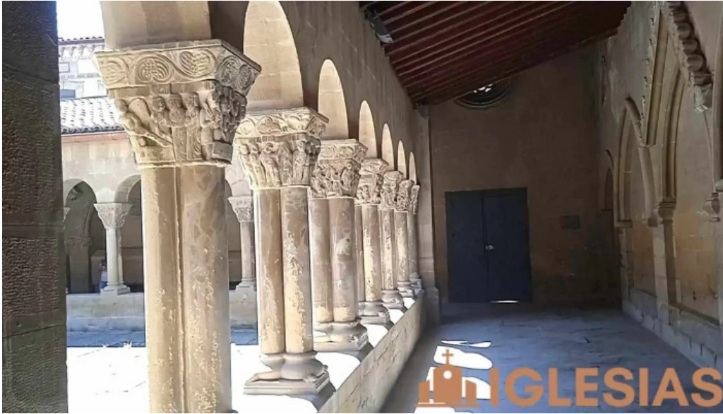
Monasterio de san pedro el viejo videos