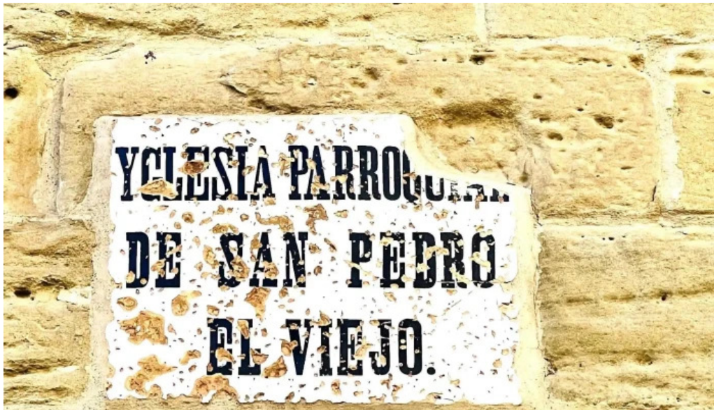
Monasterio de san pedro el viejo comentario 7