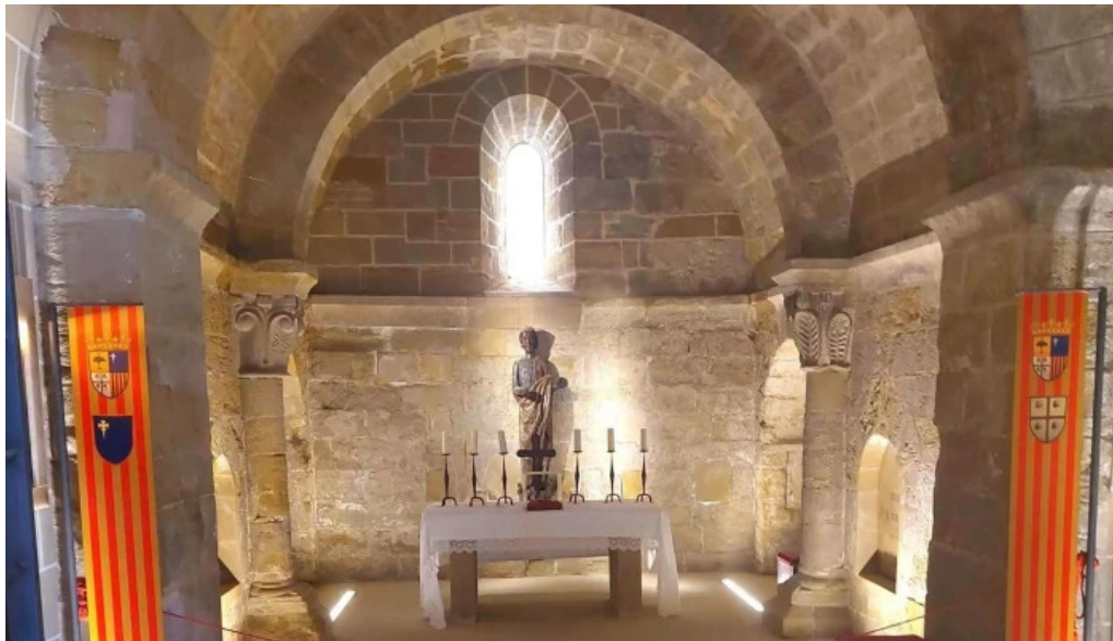
Monasterio de san pedro el viejo comentario 9