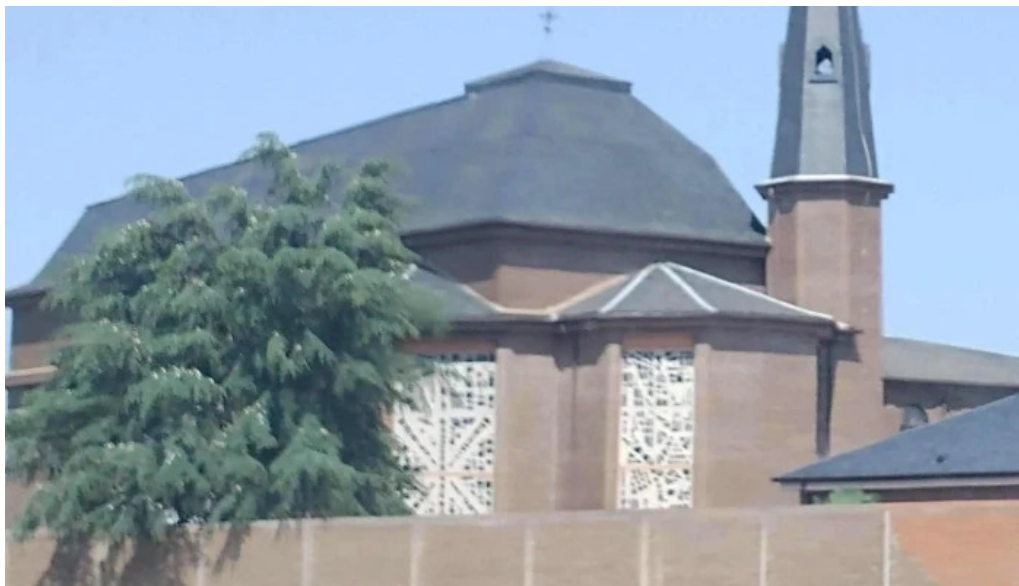
Monasterio cisterciense de el salvador instagram