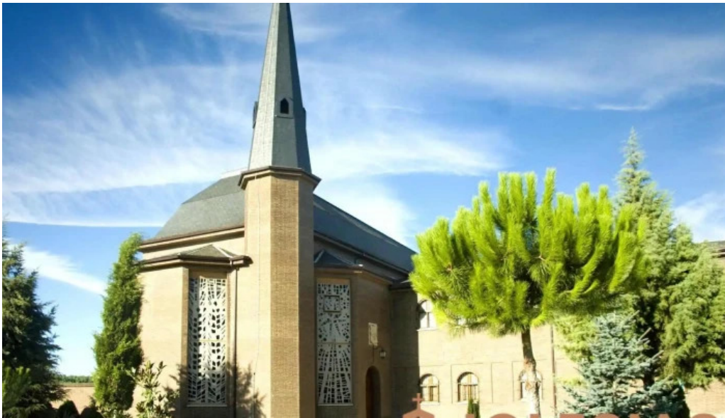
Monasterio cisterciense de el salvador monasterio