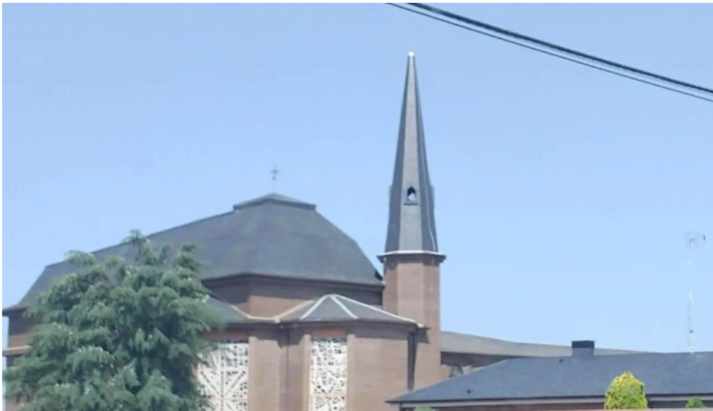
Monasterio cisterciense de el salvador benavente