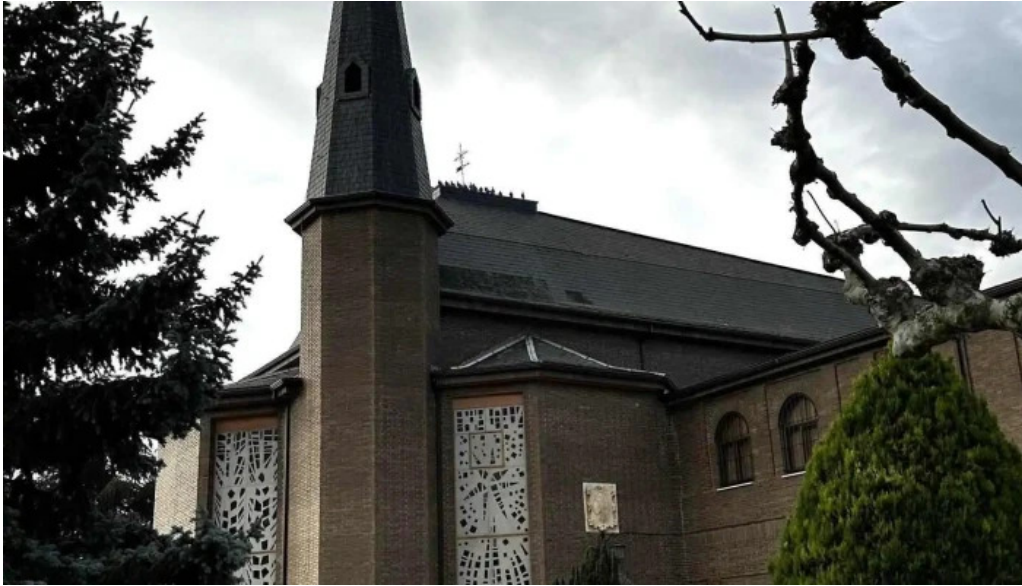
Monasterio cisterciense de el salvador recientes