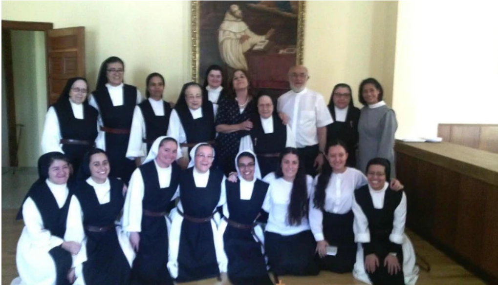
Monasterio cisterciense de el salvador del propietario