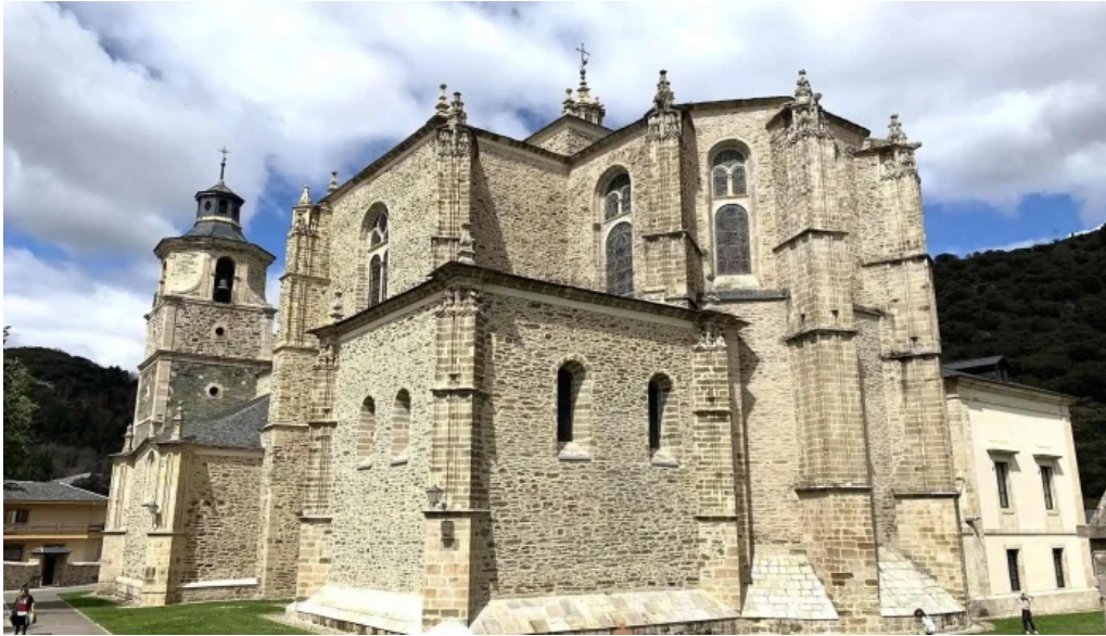
Colegiata de santa maria de cluni lugar de interes historico