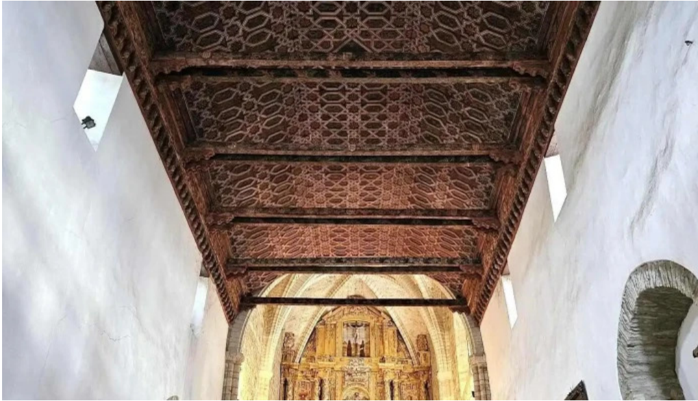
Colegiata de santa maria de cluni iglesia de san francisco