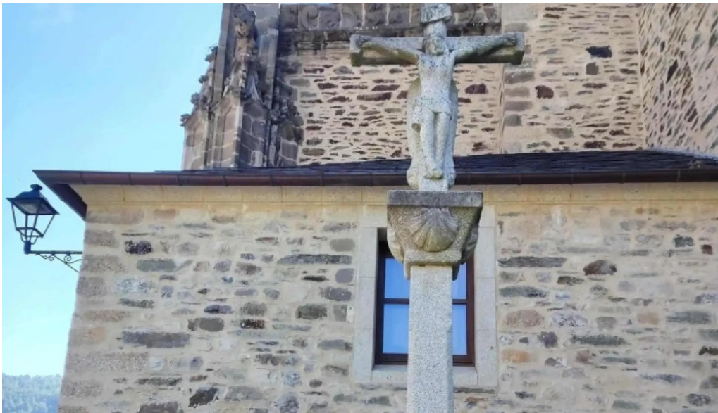
Colegiata de santa maria de cluni cerca de mi