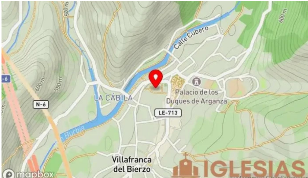
Colegiata de santa maria de cluni mapa