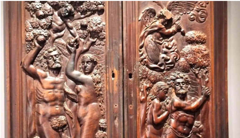
Colegiata de santa maria de cluni sitio web