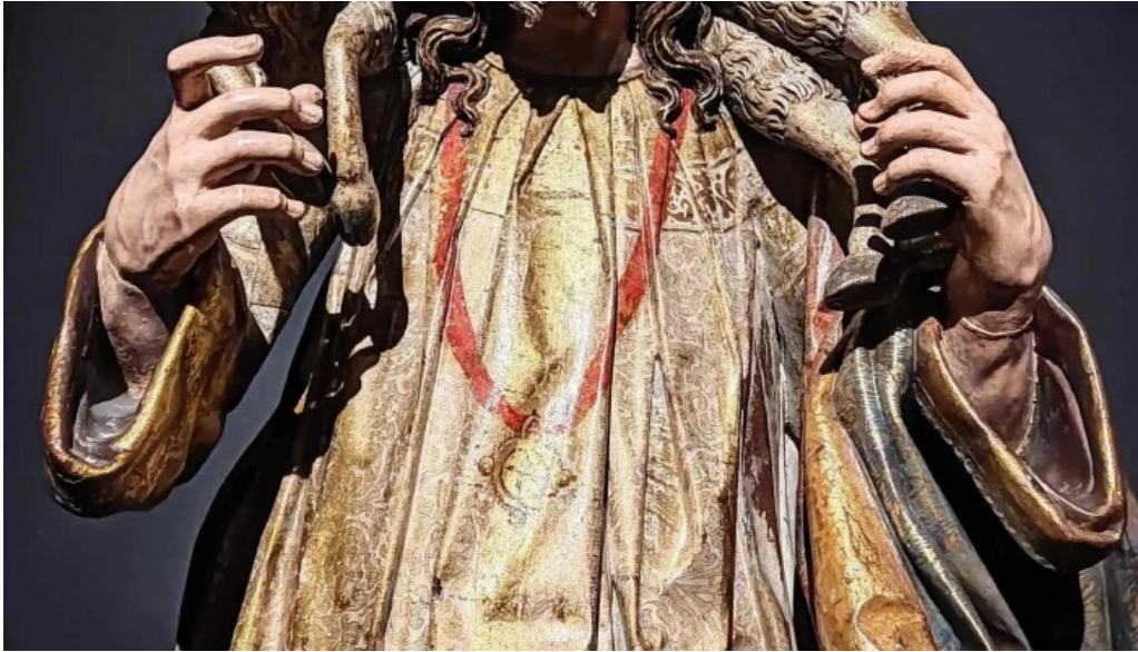
Colegiata de santa maria de cluni ubicacion