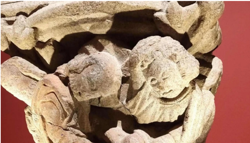
Colegiata de santa maria de cluni telefono