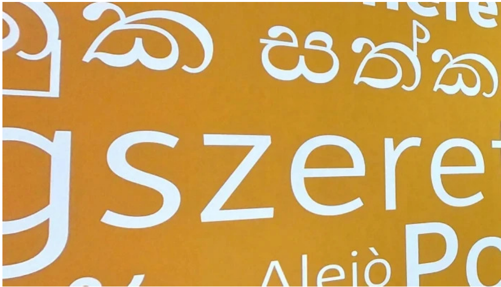
Colegiata de santa maria de cluni opiniones