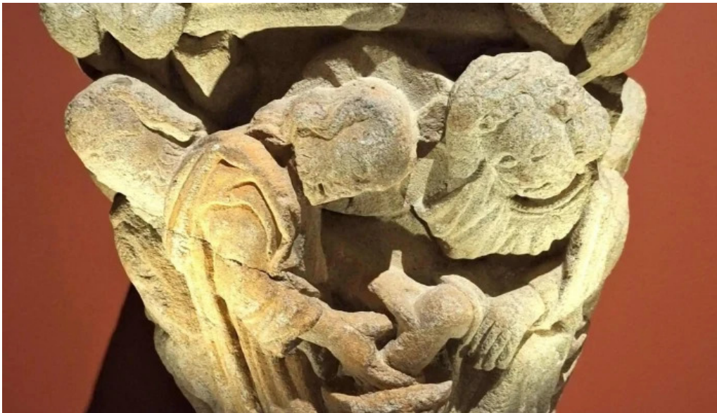
Colegiata de santa maria de cluni descuentos