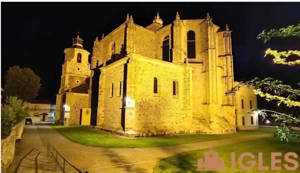
Colegiata de santa maria de cluni recientes