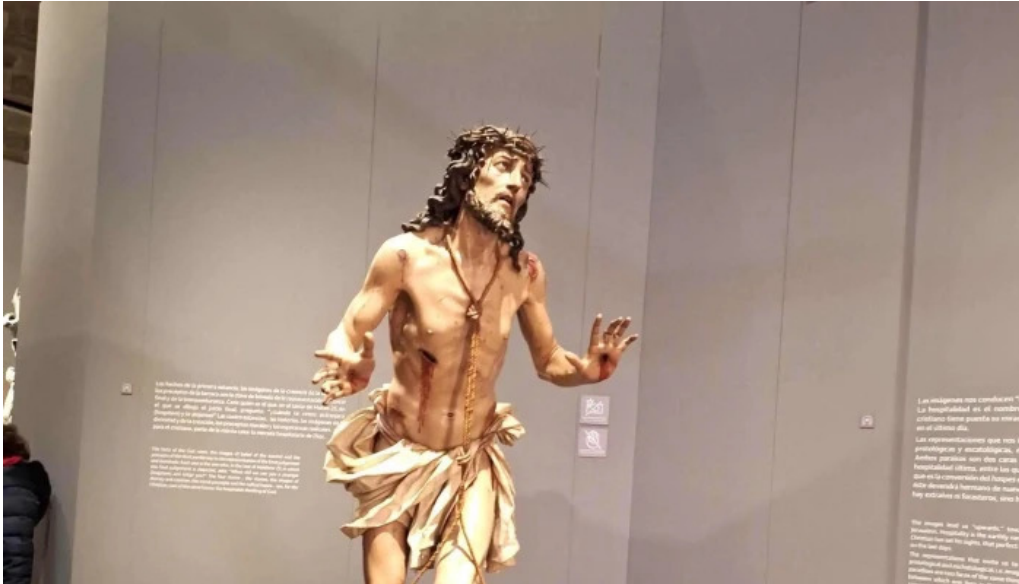
Colegiata de santa maria de cluni comentarios