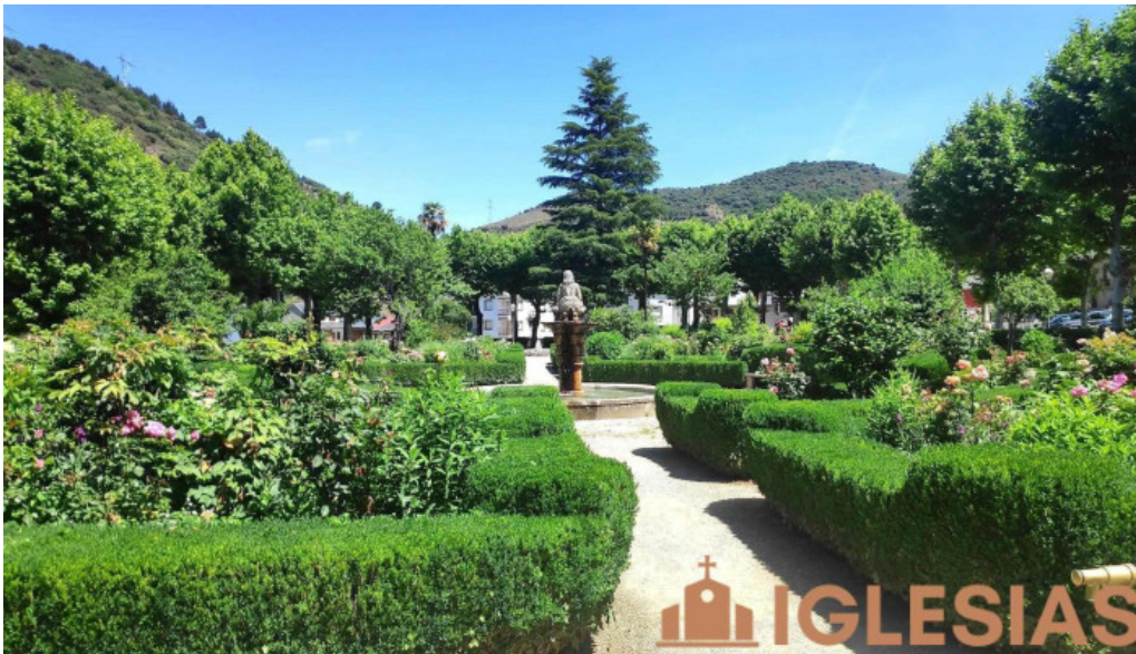
Colegiata de santa maria de cluni jardin de la alameda