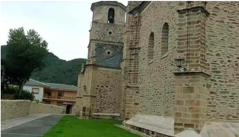
Colegiata de santa maria de cluni videos