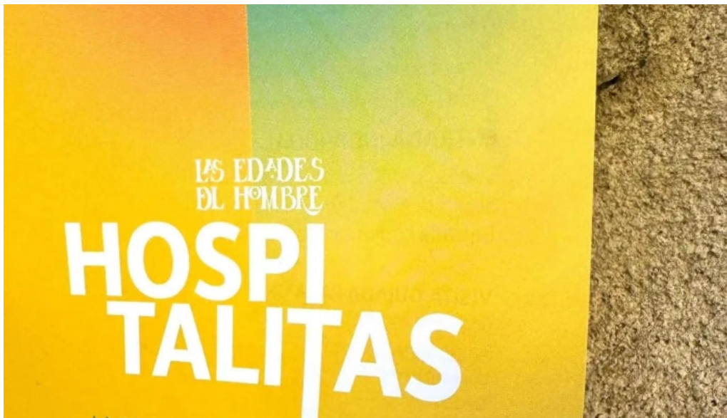
Colegiata de santa maria de cluni villafranca del bierzo