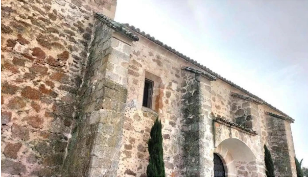
Iglesia de santa maria magdalena valdehuncar