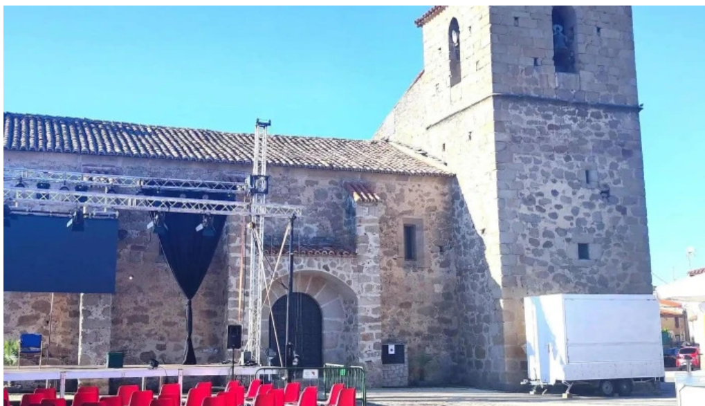
Iglesia de santa maria magdalena comentario 1