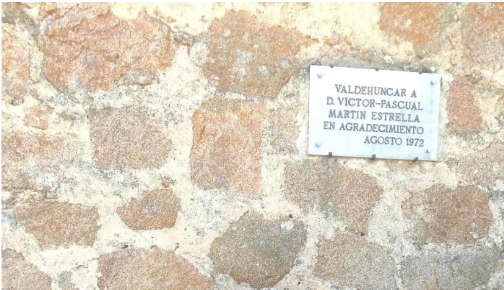
Iglesia de santa maria magdalena comentario 2