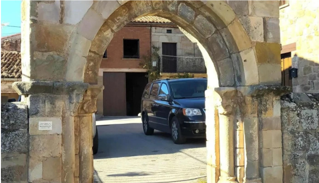
Portada romanica de la iglesia mazariegos direccion