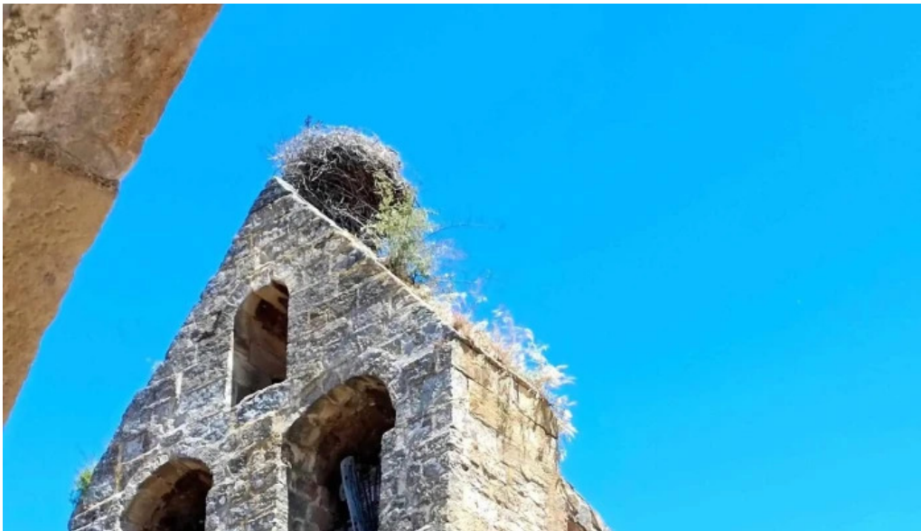
Portada romanica de la iglesia mazariegos instagram