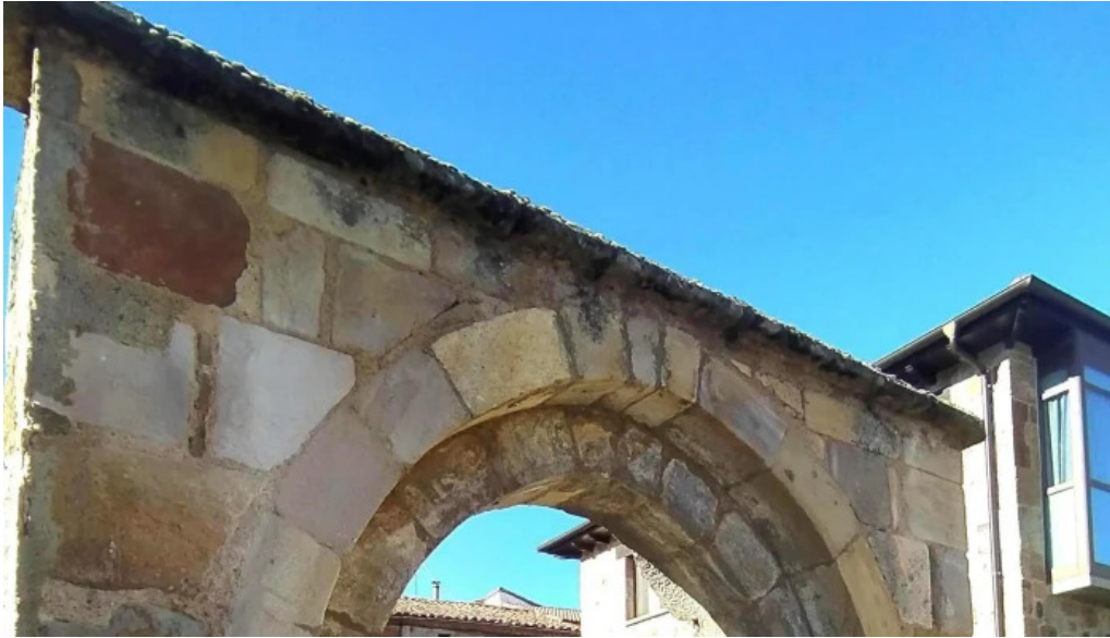
Portada romanica de la iglesia mazariegos sitio web