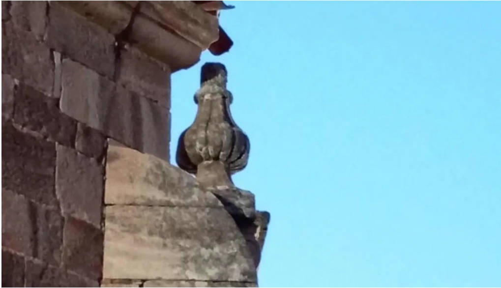
Portada romanica de la iglesia mazariegos zona