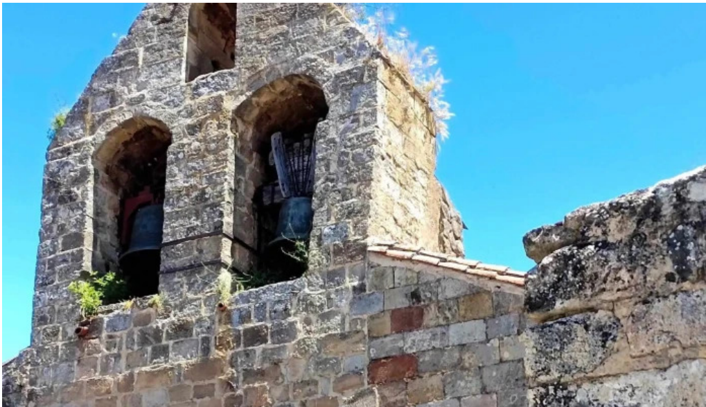
Portada romanica de la iglesia mazariegos salas de los infantiles