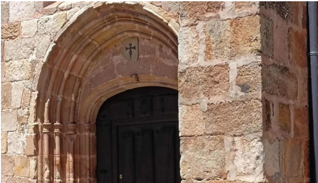
Portada romanica de la iglesia mazariegos descuentos