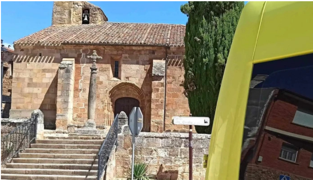
Portada romanica de la iglesia mazariegos videos