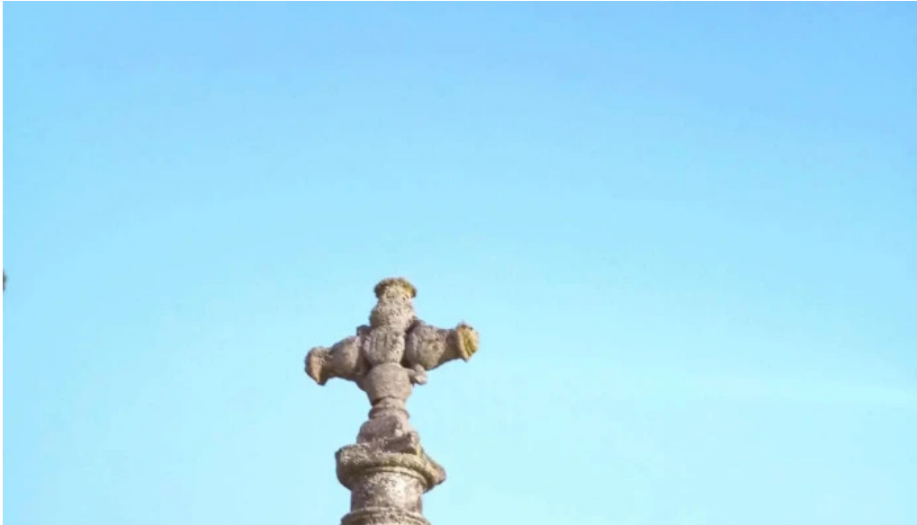
Portada romanica de la iglesia mazariegos puntaje