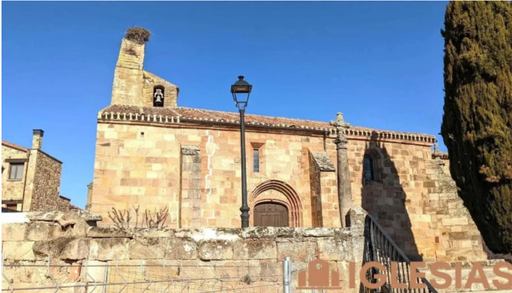
Portada romanica de la iglesia mazariegos lugar de interes historico