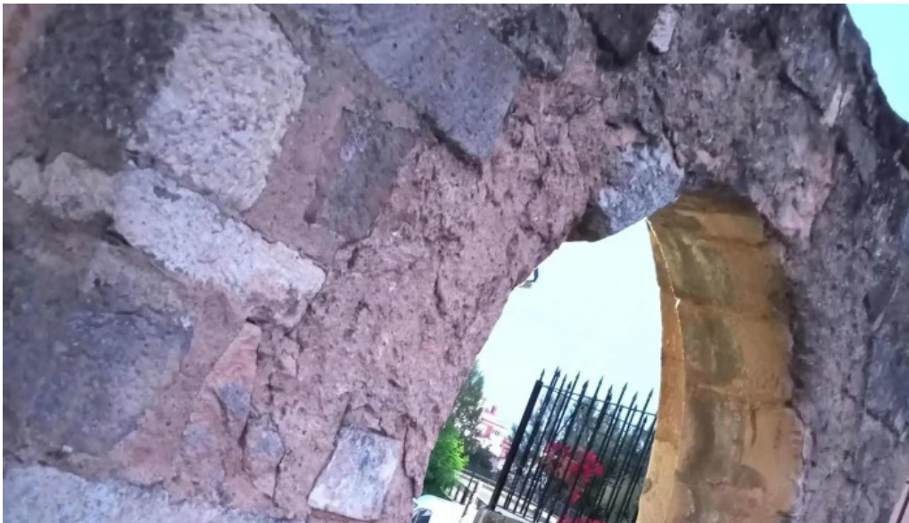
Portada romanica de la iglesia mazariegos fotos