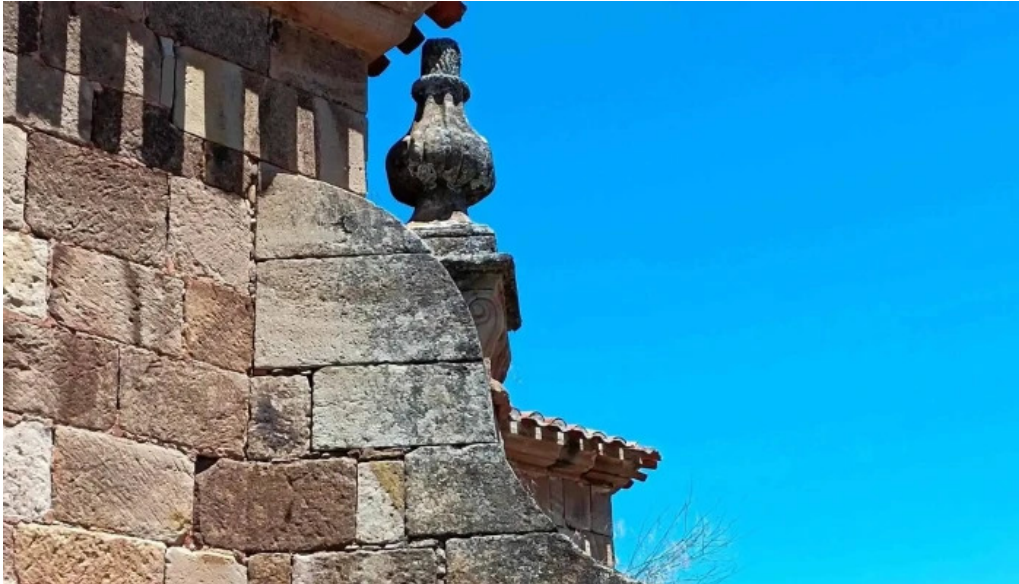
Portada romanica de la iglesia mazariegos horario