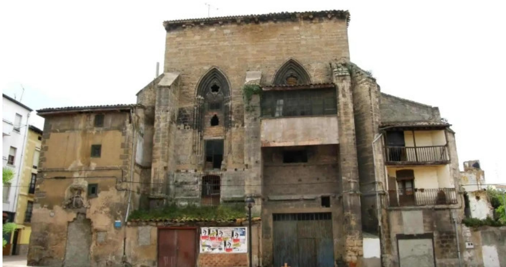
Iglesia de san juan lugar de interes historico