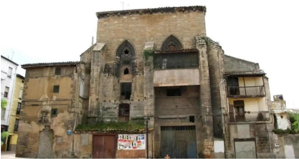
Iglesia de san juan miranda de ebro