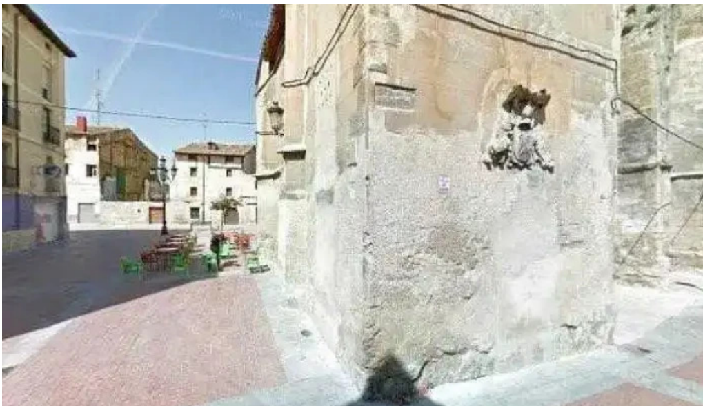
Iglesia de san juan zona