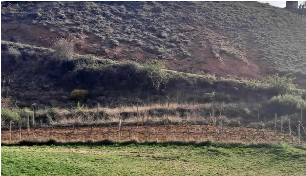
Ermita de san alejo videos