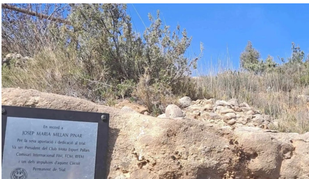
Ermita de san alejo lleida