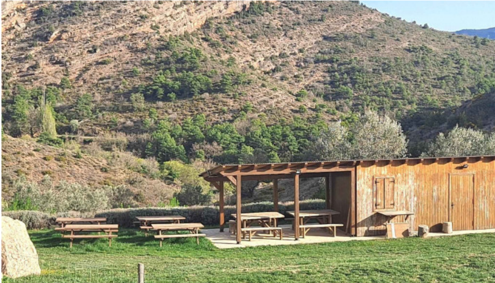
Ermita de san alejo comentarios