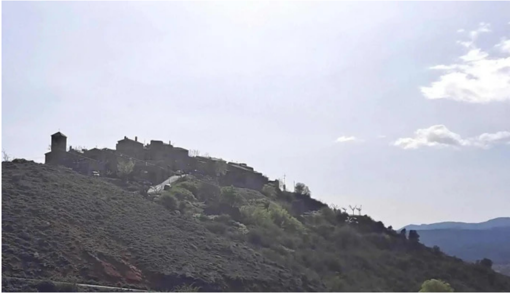
Ermita de san alejo opiniones