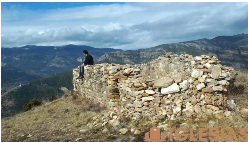
Ermita de san alejo lugar de interes historico