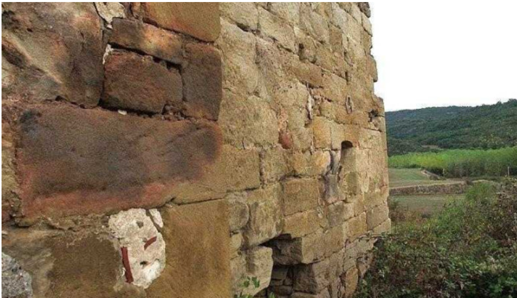
Iglesia de san pelayo ruinas lugar de interes historico