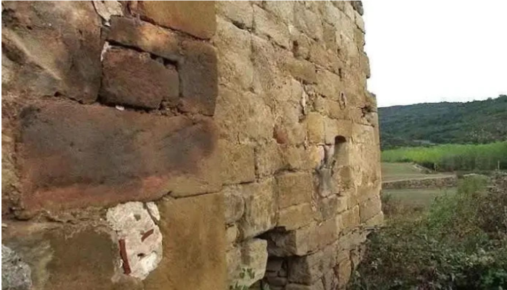
Iglesia de san pelayo ruinas igay