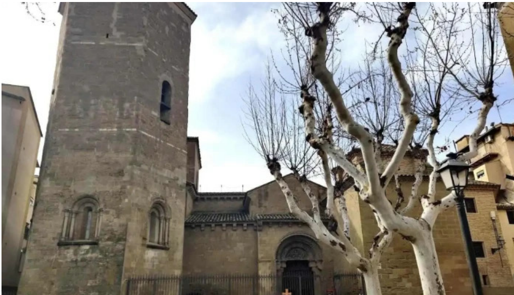
Torre de la iglesia de san pedro huesca