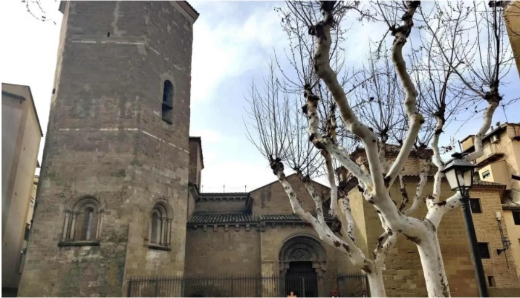
Torre de la iglesia de san pedro iglesia