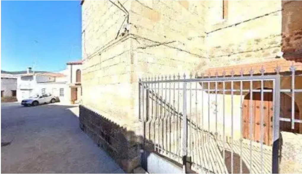
Iglesia de nuestra senora de la asuncion opiniones