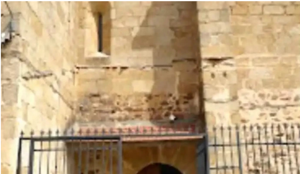
Iglesia de nuestra senora de la asuncion garvin