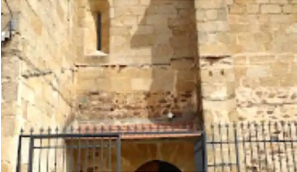
Iglesia de nuestra senora de la asuncion lugar de interes historico