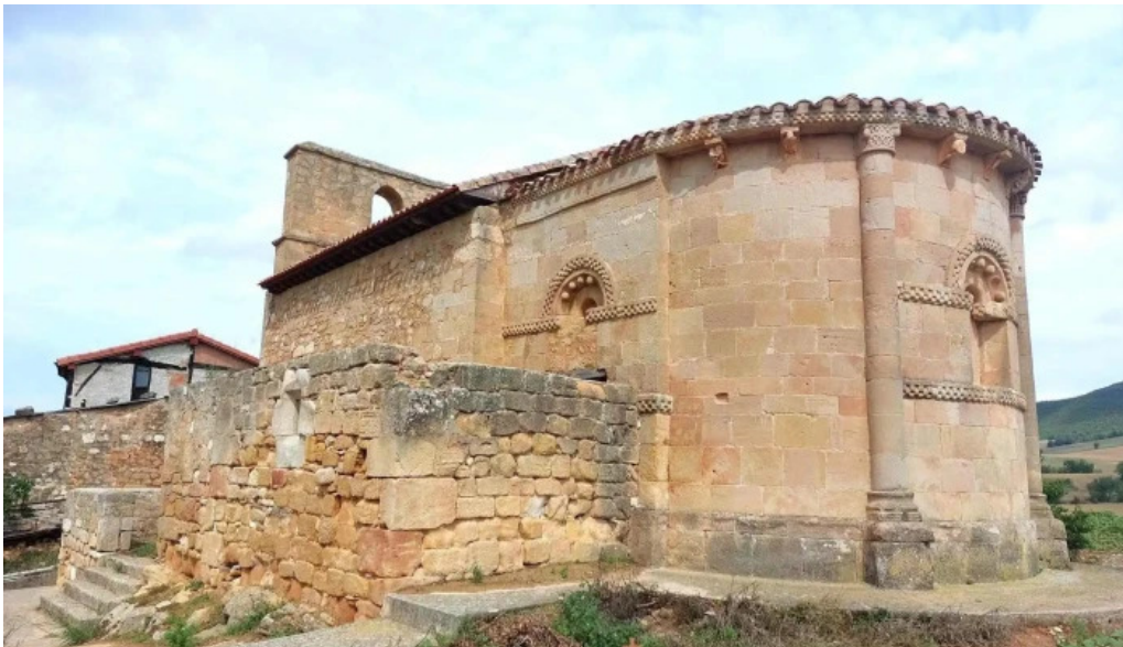
Ermita de santa maria de tobera lugar de interes historico