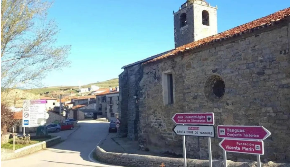
Iglesia de nuestra señora del vado villar del rio