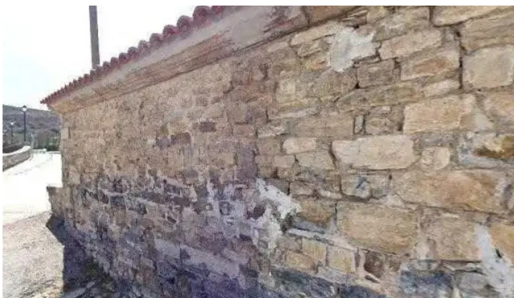
Iglesia de nuestra senora del vado horario