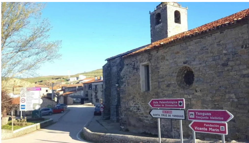
Iglesia de nuestra senora del vado lugar de culto