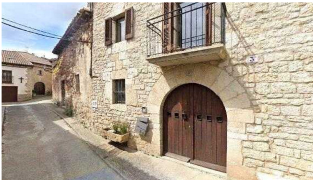
Iglesia de san julian lugar de culto