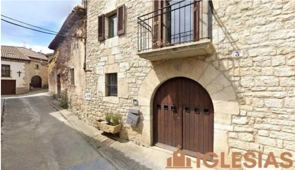
Iglesia de san julian vidaurreta