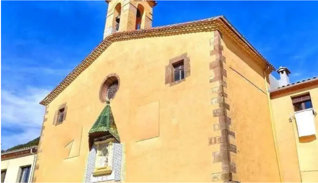
Santuario de la salud vallfogona de ripolles