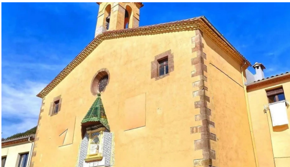
Santuario de la salud lugar de culto