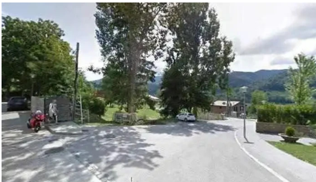
Santuario de la salud direccion