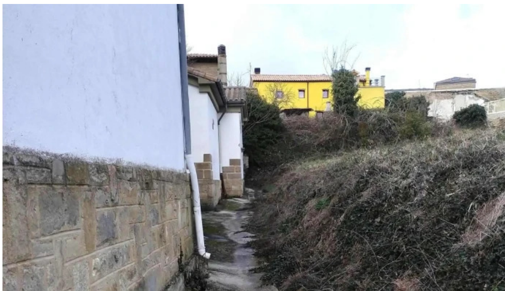
Iglesia nueva de san pedro direccion