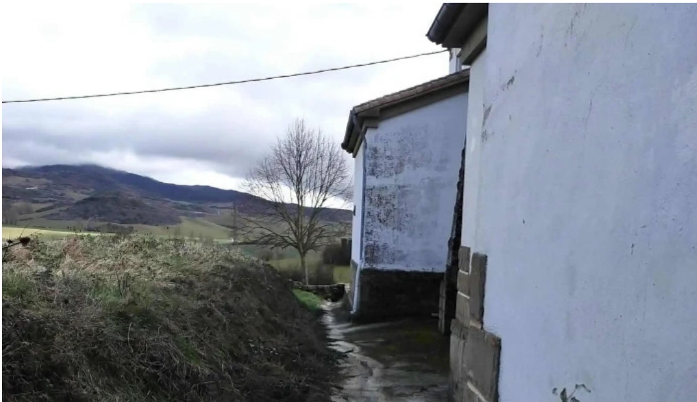
Iglesia nueva de san pedro zona