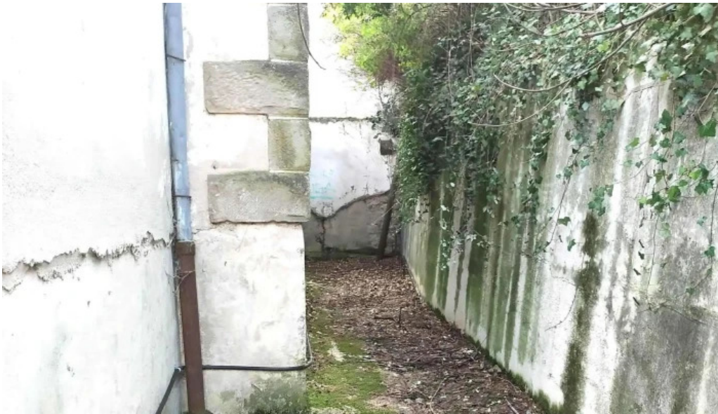
Iglesia nueva de san pedro donde