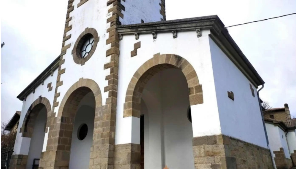
Iglesia nueva de san pedro lugar de culto