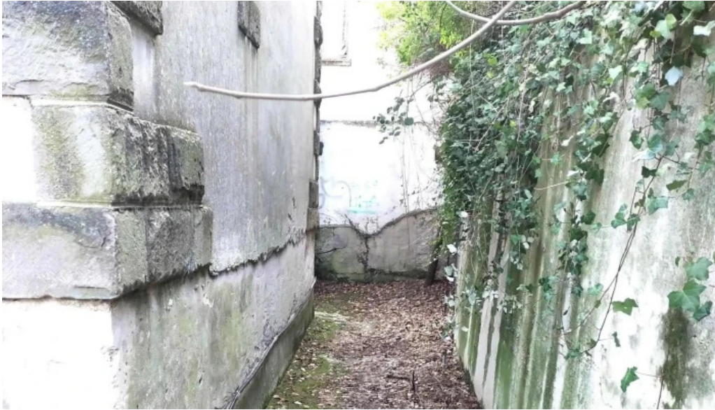
Iglesia nueva de san pedro unciti