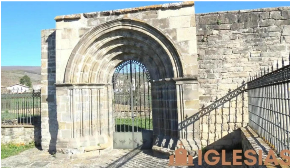
Iglesia de san pedro unciti