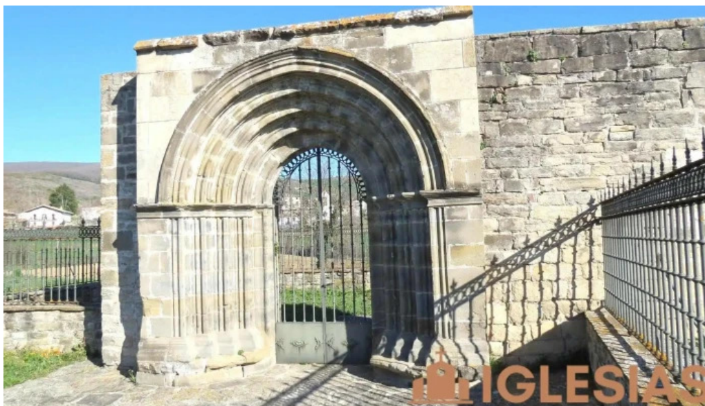
Iglesia de san pedro lugar de culto