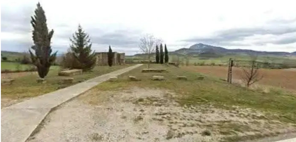
Iglesia de san pedro promocion