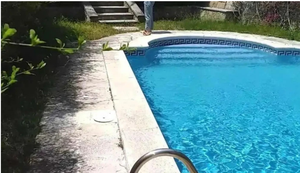
Ermita de la cisa videos