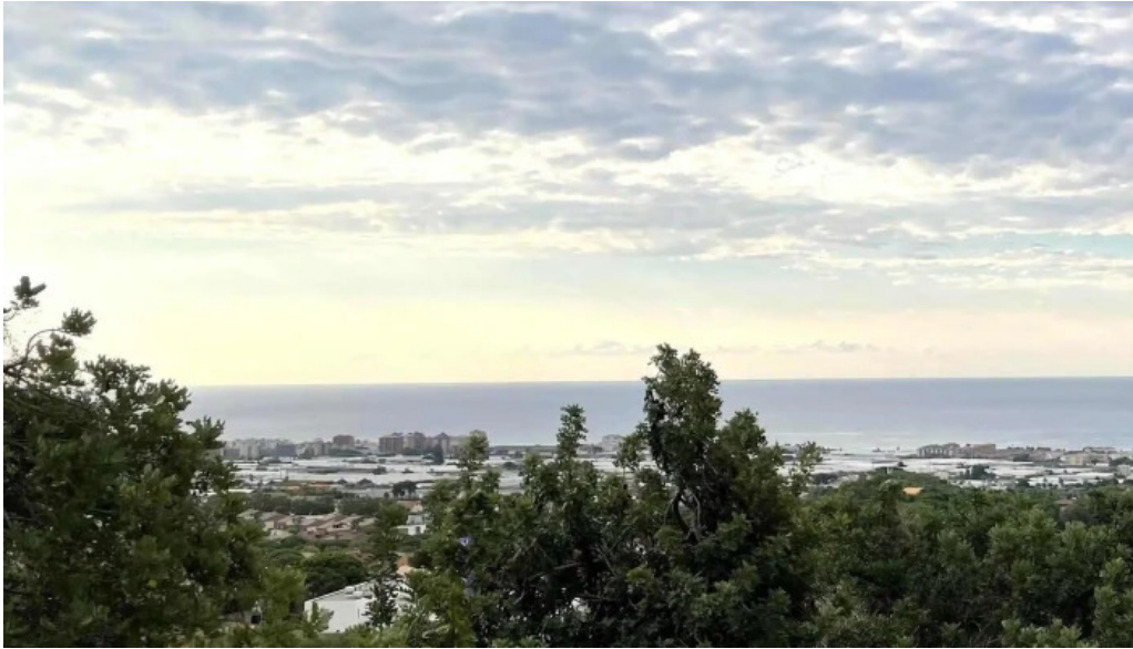
Ermite de la cisa premia de dalt