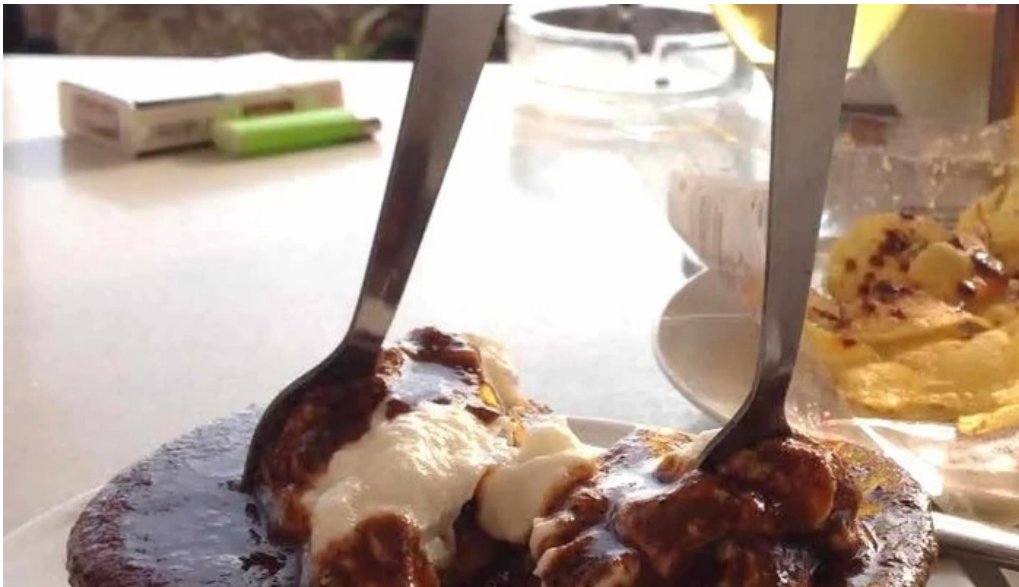
Ermita de la cisa ubicacion