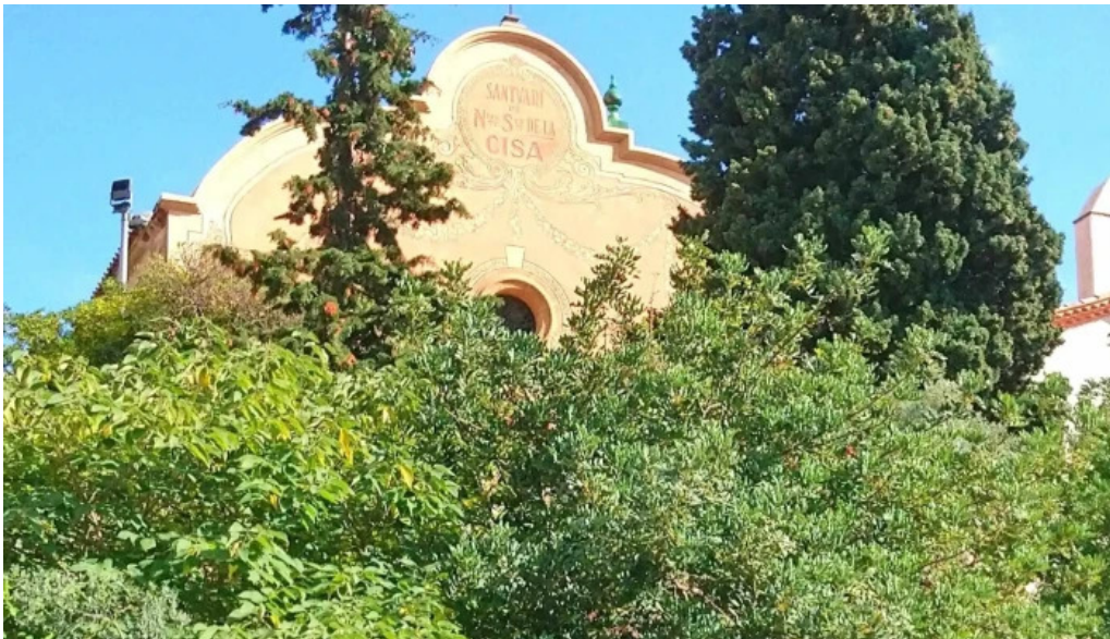
Ermita de la cisa sitio web