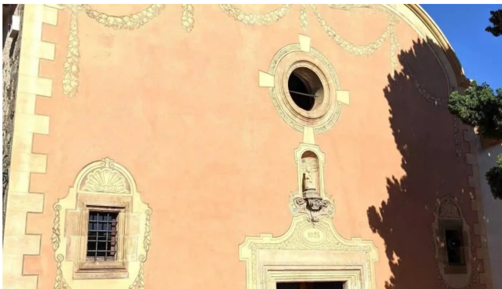
Ermita de la cisa lugar de culto