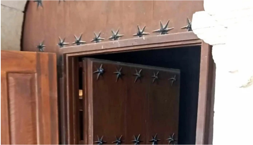
Iglesia de san cornelio y san cipriano opiniones