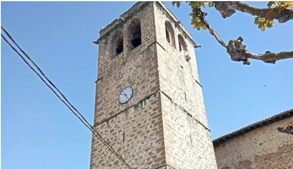
Iglesia de san cornelio y san cipriano catalogo