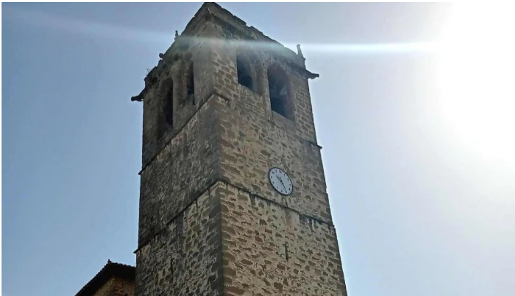
Iglesia de san cornelio y san cipriano pangua