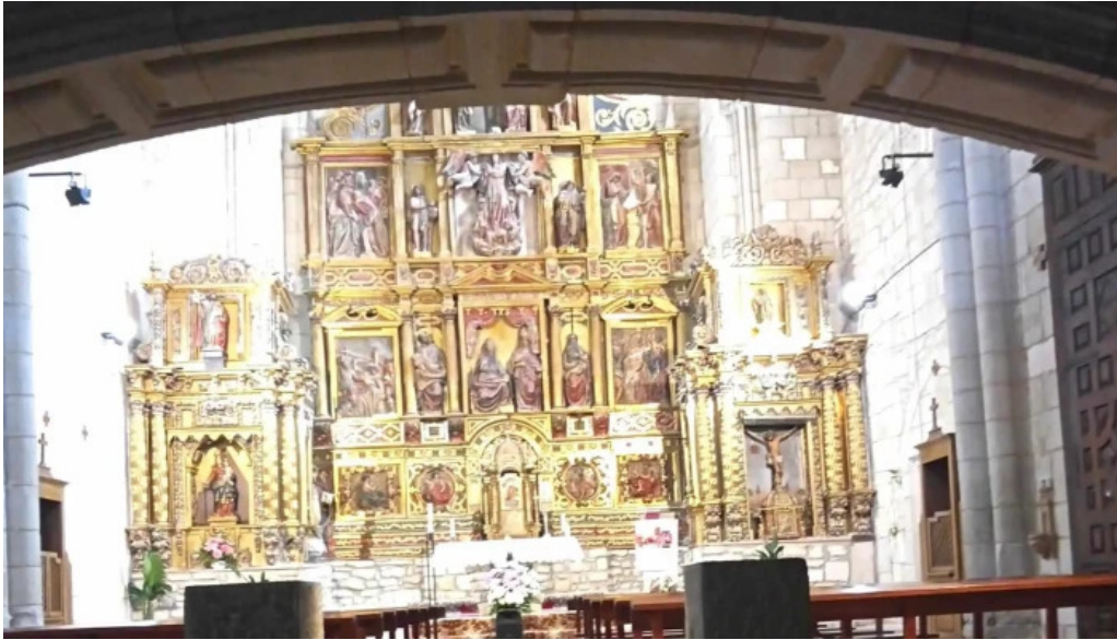
Iglesia de san cornelio y san cipriano videos