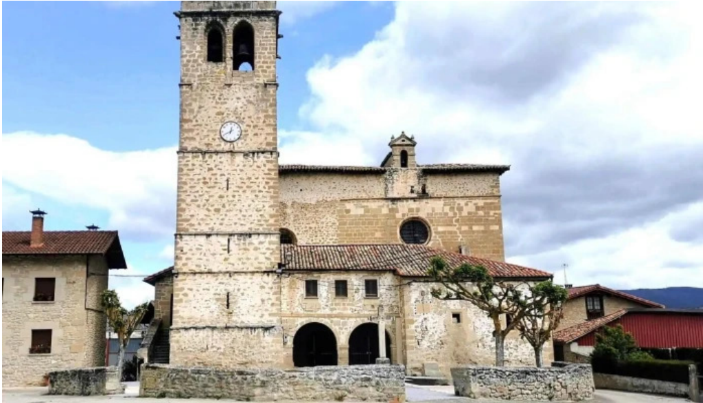
Iglesia de san cornelio y san cipriano lugar de culto