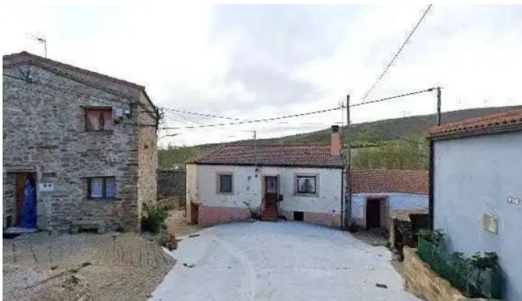
Iglesia de san bartolome apostol lugar de culto