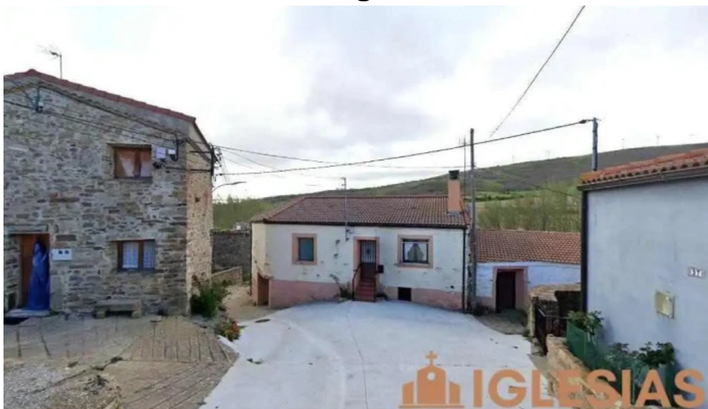
Iglesia de san bartolome apostol palacio de san pedro