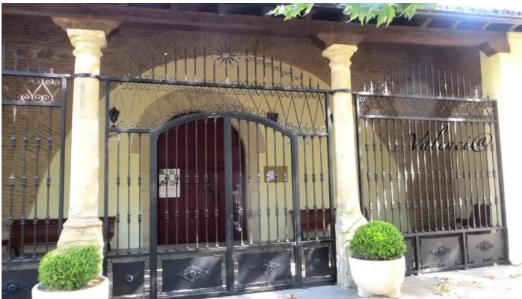
Ermita de la virgen del templo pajares de la lampreana