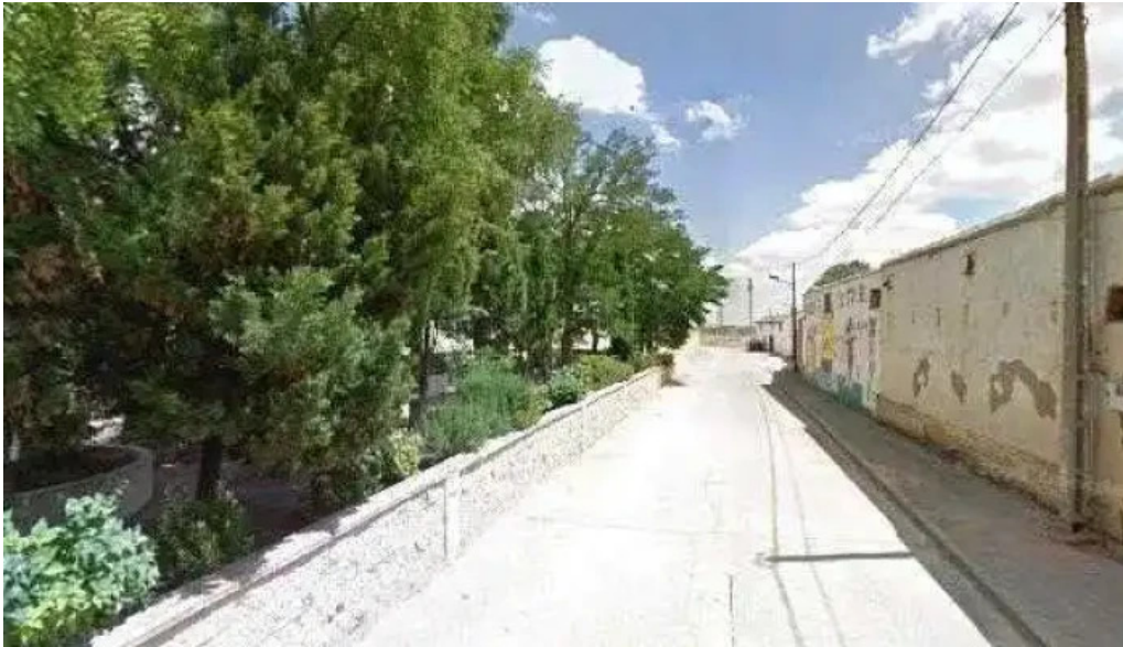
Ermita de la virgen del templo promocion