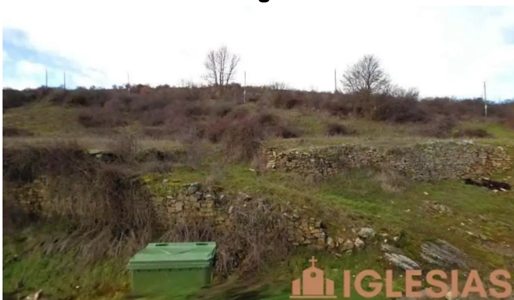
Iglesia de la asuncion de nuestra senora navabellida