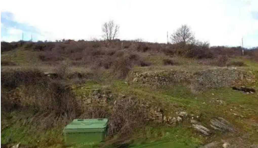
Iglesia de la asuncion de nuestra senora lugar de culto