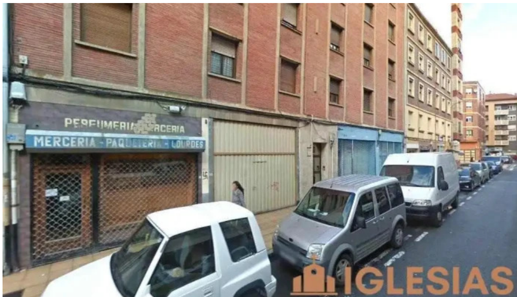
Iglesia evangelica apostolica del nombre de jesus miranda de ebro