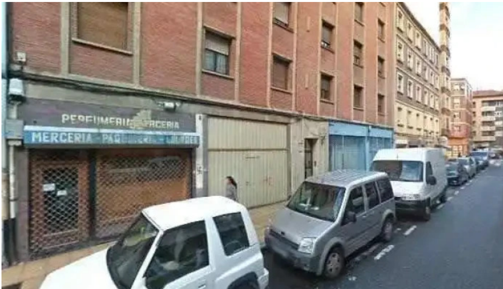
Iglesia evangelica apostolica del nombre de jesus lugar de culto