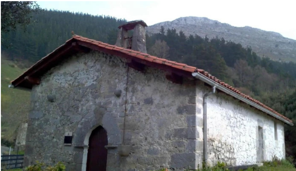
Ermita de san martin lugar de culto