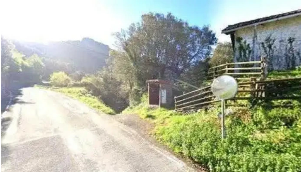
Ermita de san martin precios