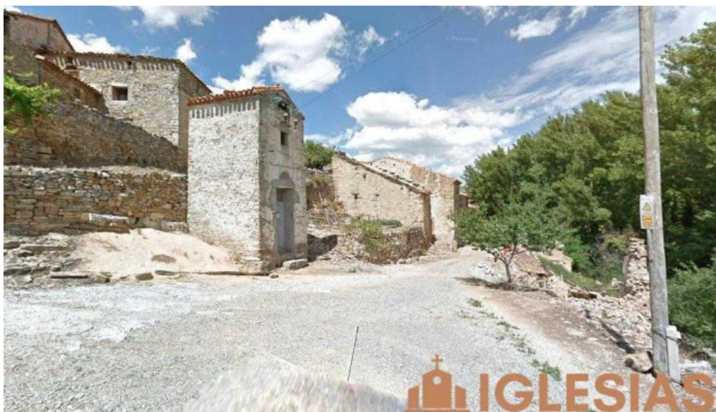
Iglesia de san clemente las fuentes de san pedro