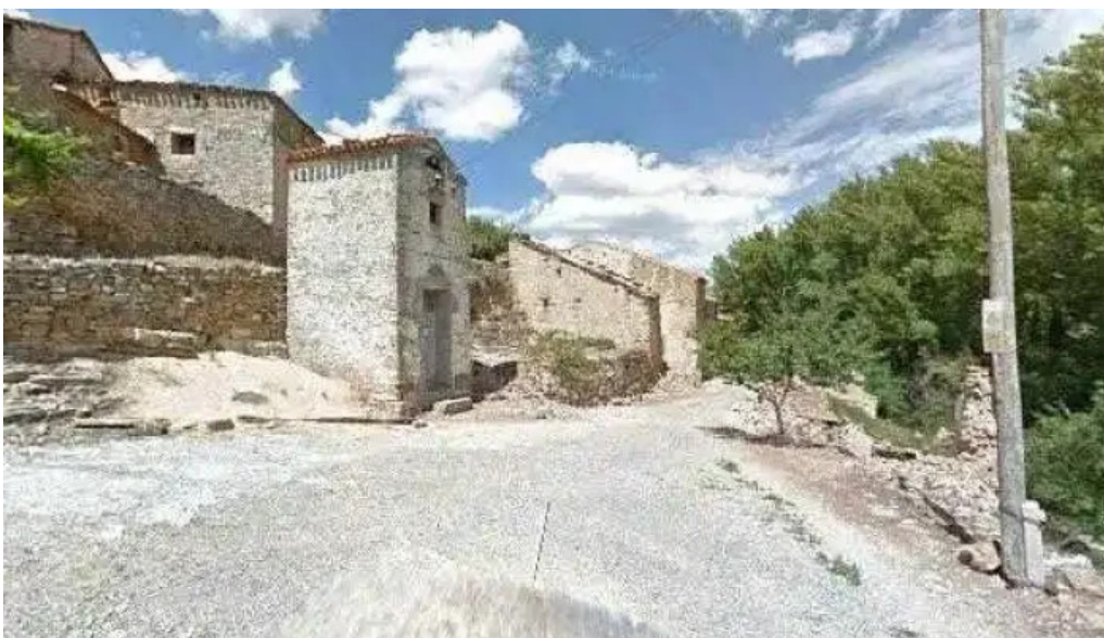
Iglesia de san clemente lugar de culto