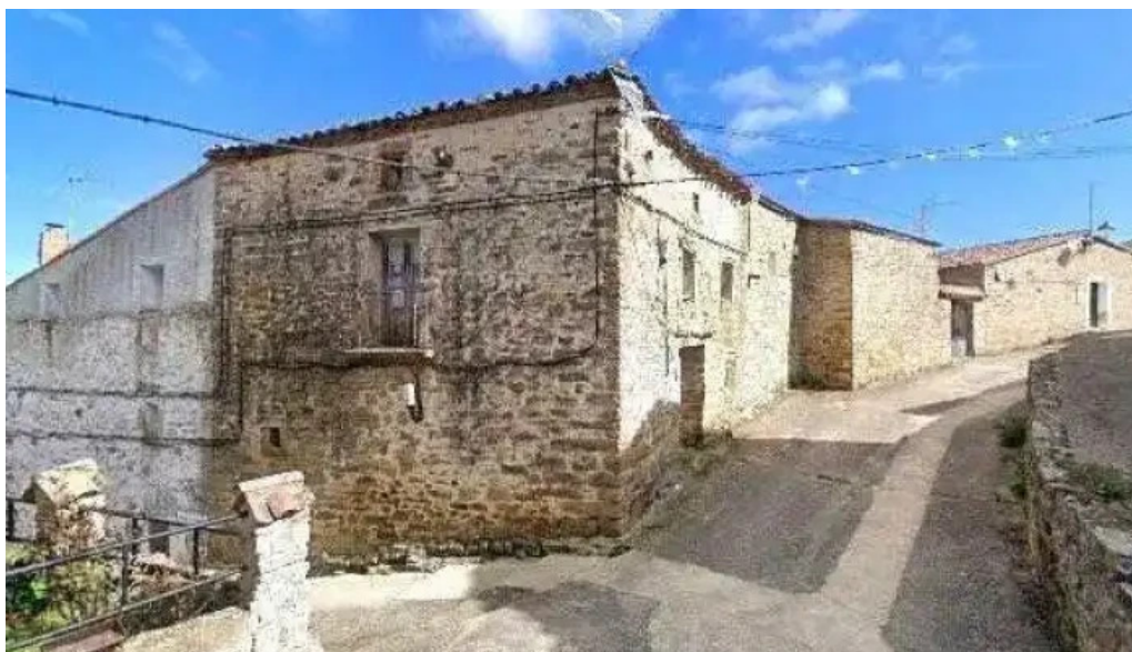
Iglesia de la asuncion de nuestra senora lugar de culto