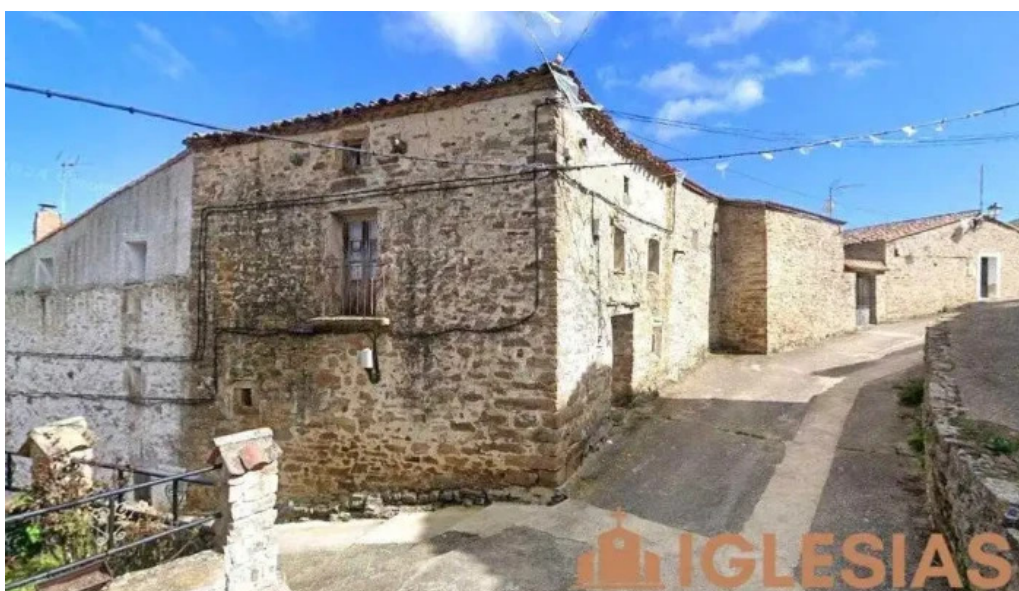
Iglesia de la asuncion de nuestra senora huertelas