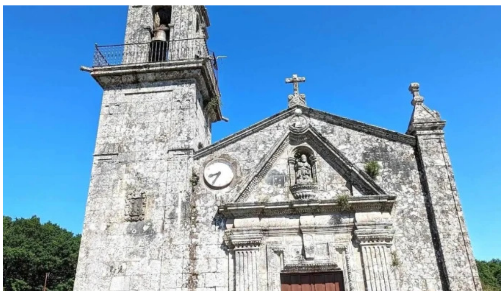
Iglesia de san pedro de poulo iglesia