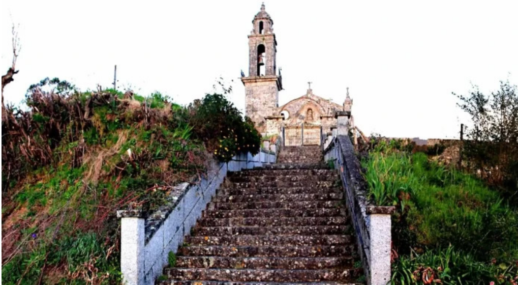
Iglesia de san pedro de poulo comentario 3