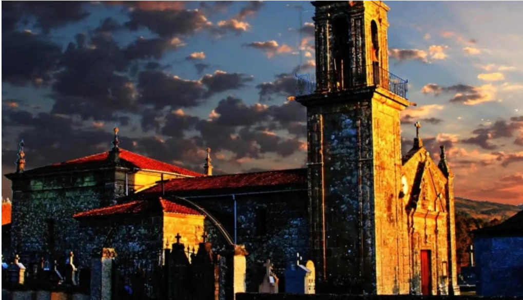
Iglesia de san pedro de poulo comentario 2