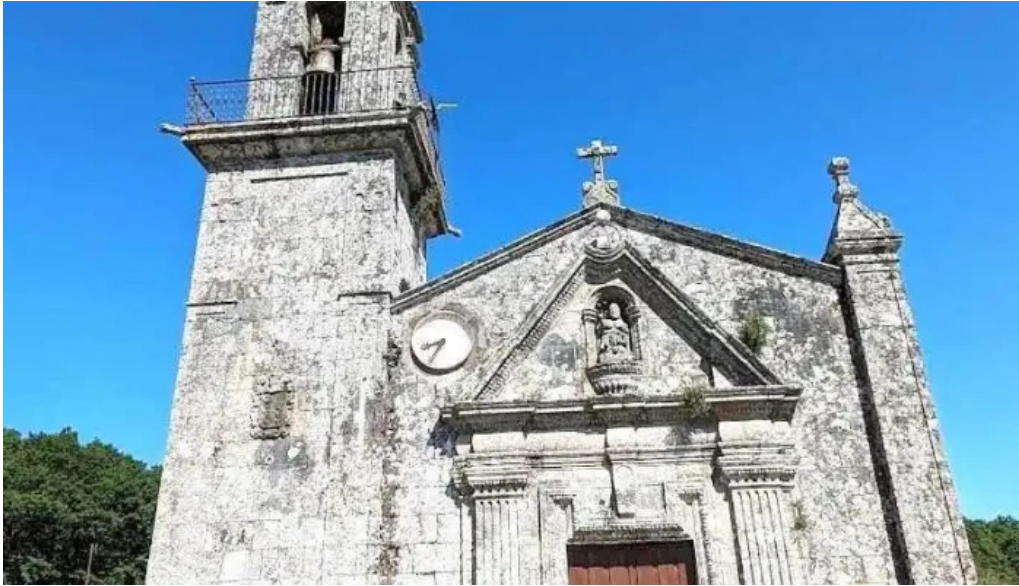
Iglesia de san pedro de poulo gomesende