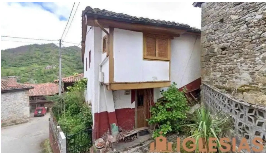
Iglesia de san pedro coballes