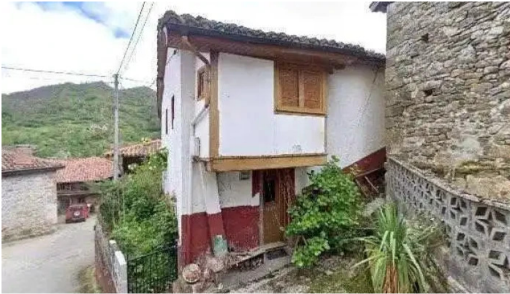
Iglesia de san pedro lugar de culto