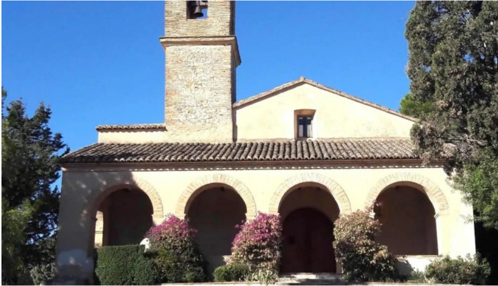
Ermita de sant antoni puntaje