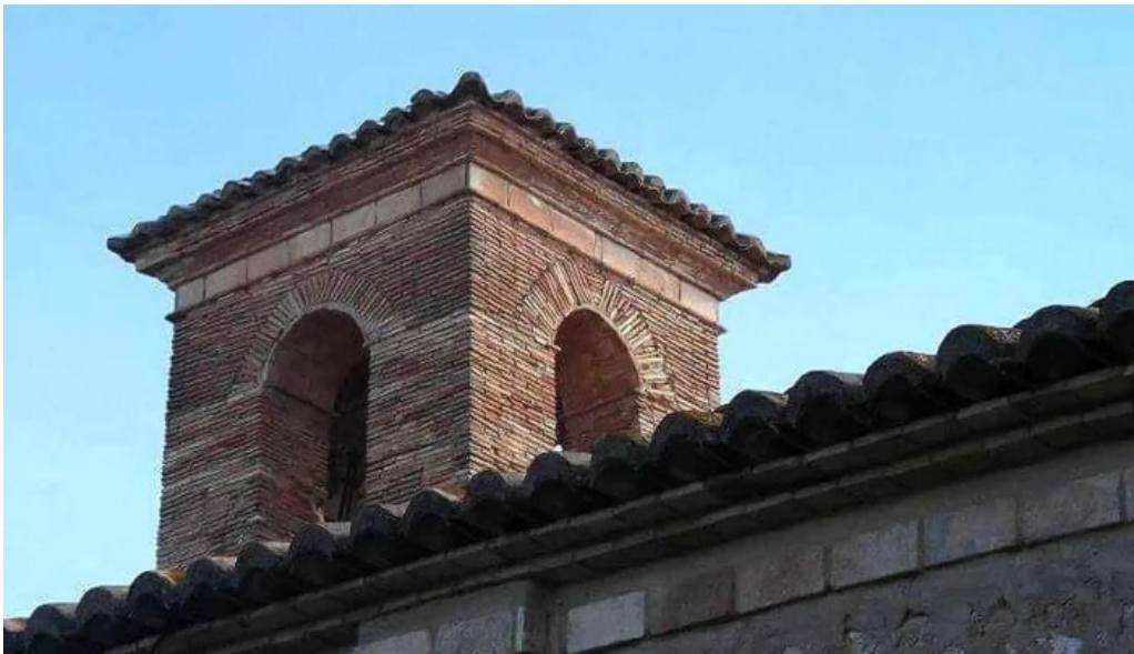
Ermita de sant antoni opiniones