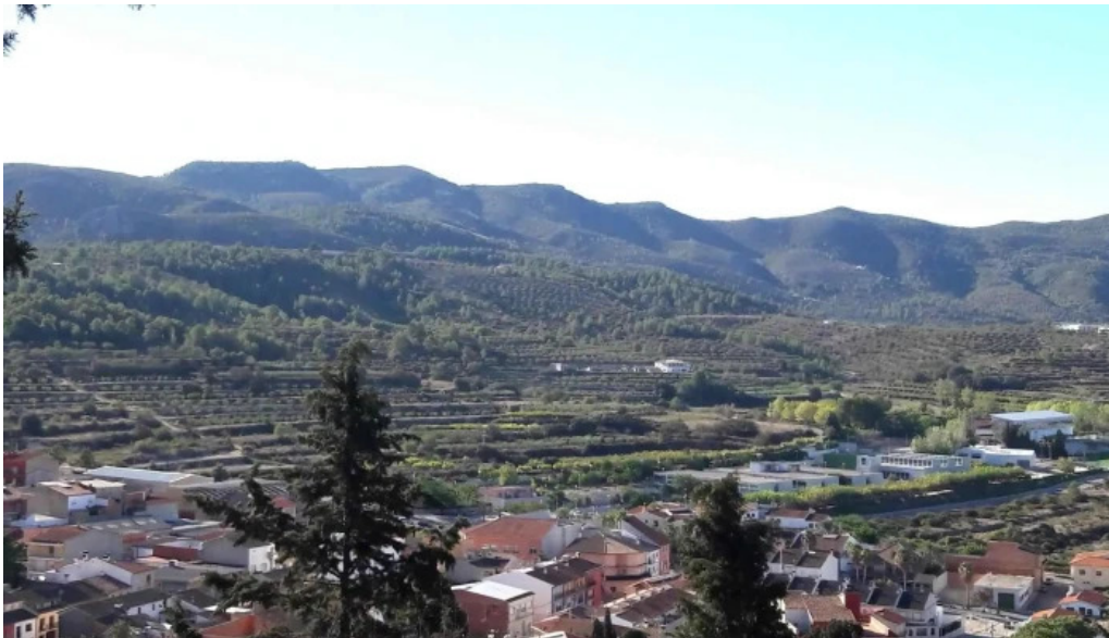
Ermita de sant antoni zona