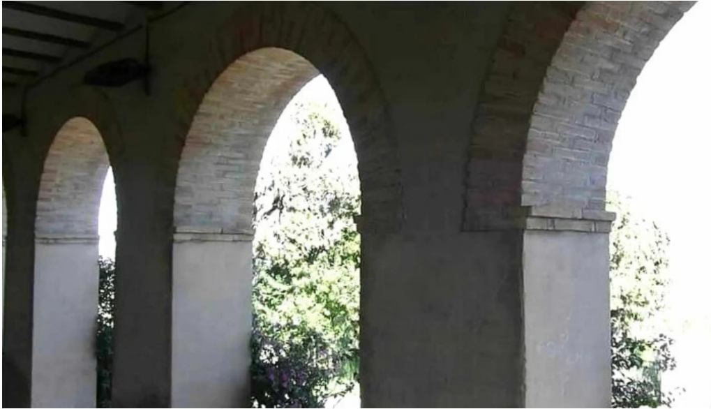
Ermita de sant antoni numero