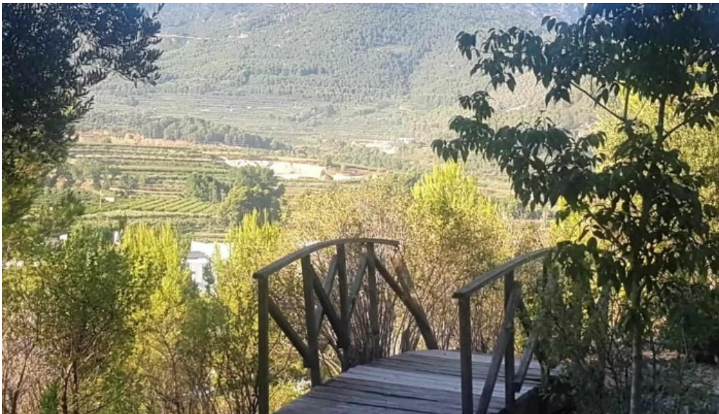
Ermita de sant antoni videos