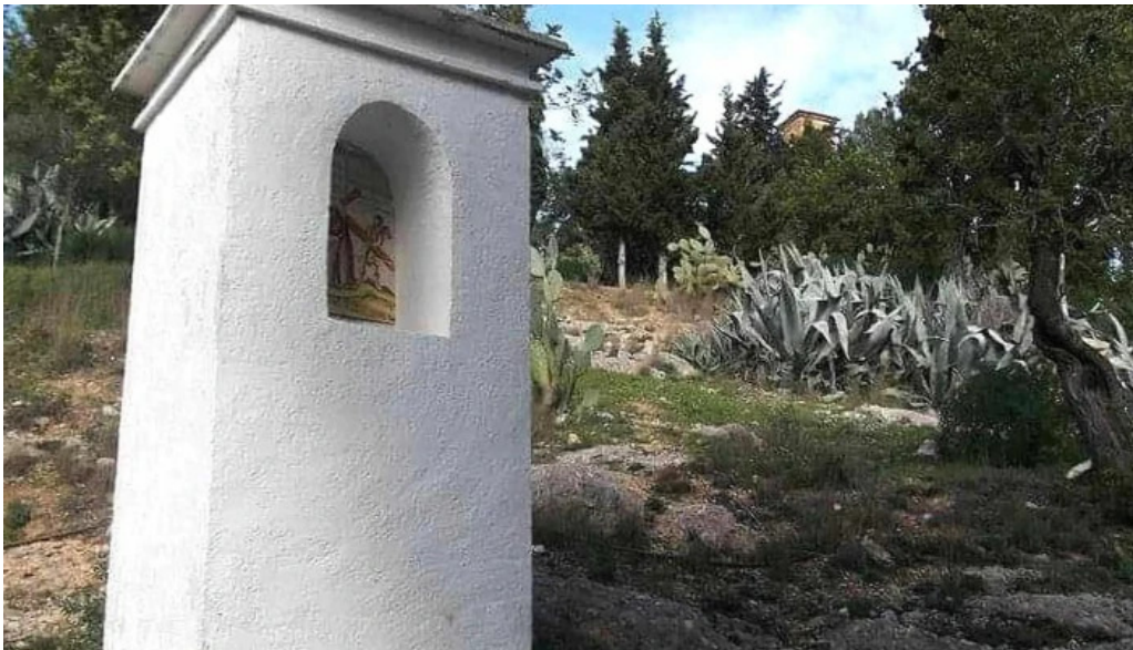
Ermita de sant antoni fotos