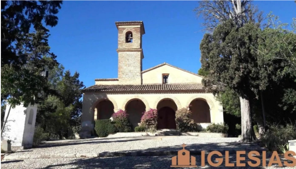
Ermita de sant antoni lugar de culto