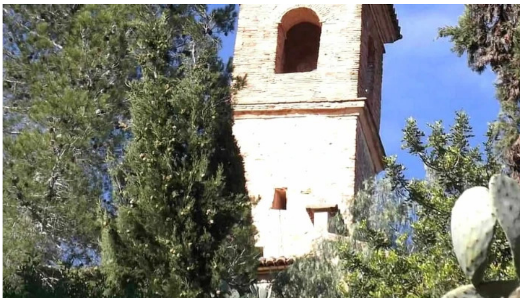
Ermita de sant antoni castello de rugat