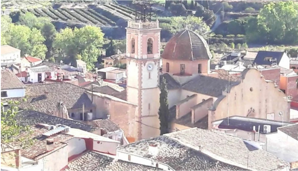
Ermita de sant antoni donde