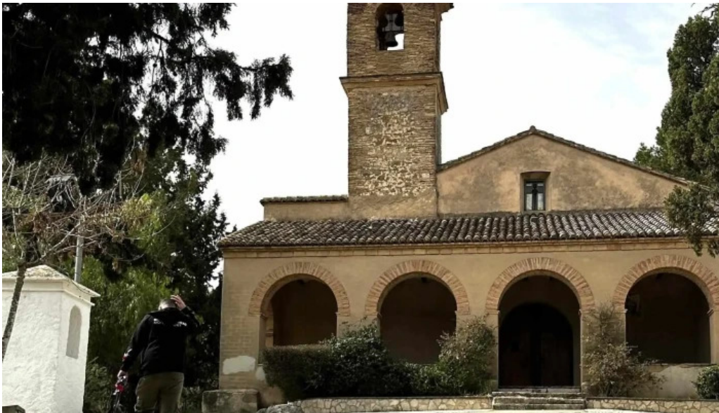
Ermita de sant antoni comentarios