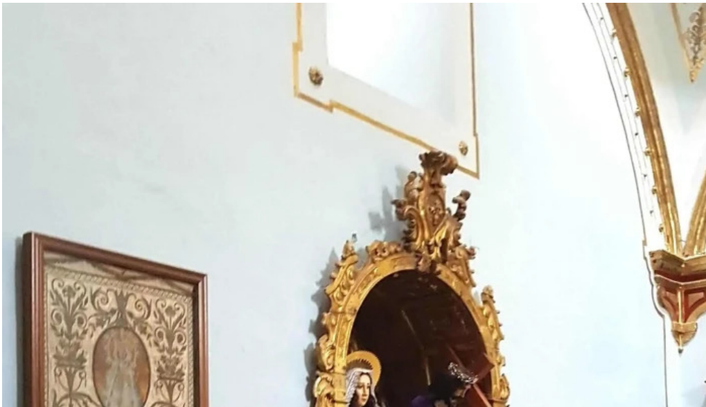
Ermita virgen de gracia direccion