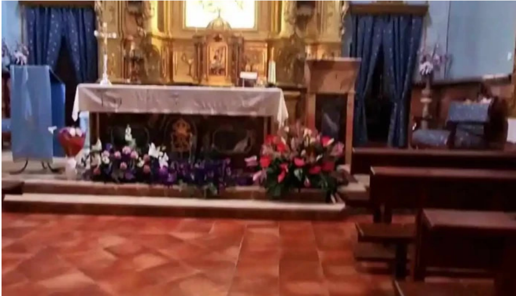
Ermita virgen de gracia videos