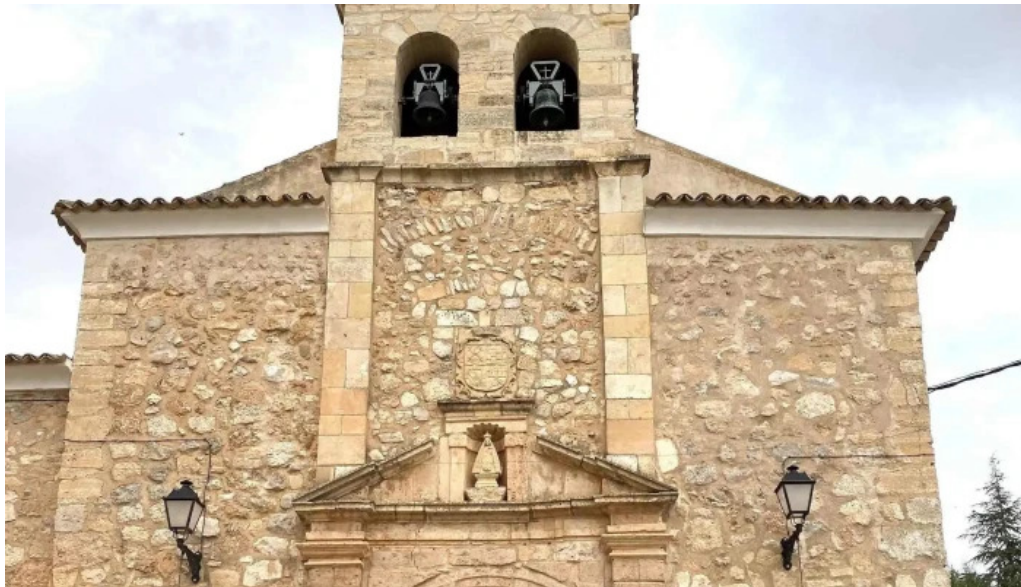
Ermita virgen de gracia numero