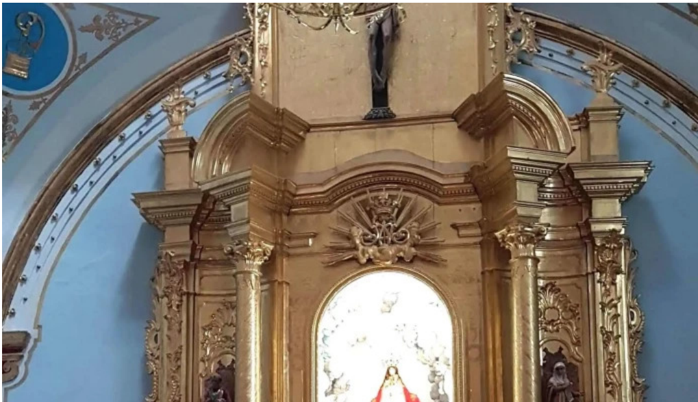
Ermita virgen de gracia sitio web