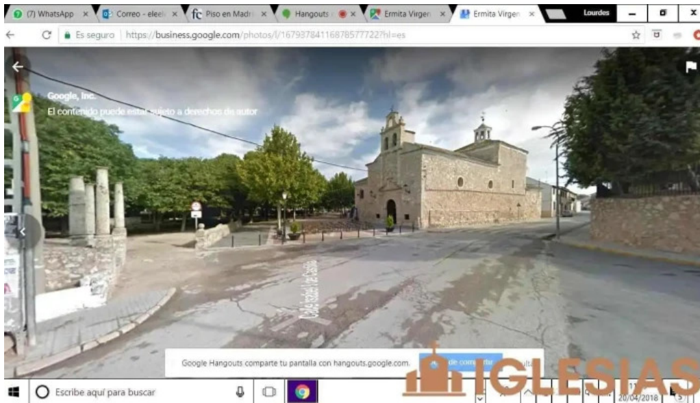
Ermita virgen de gracia del propietario