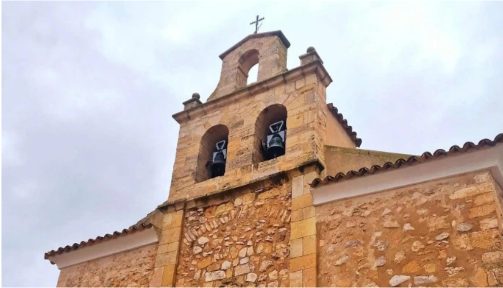
Ermita virgen de gracia comentarios