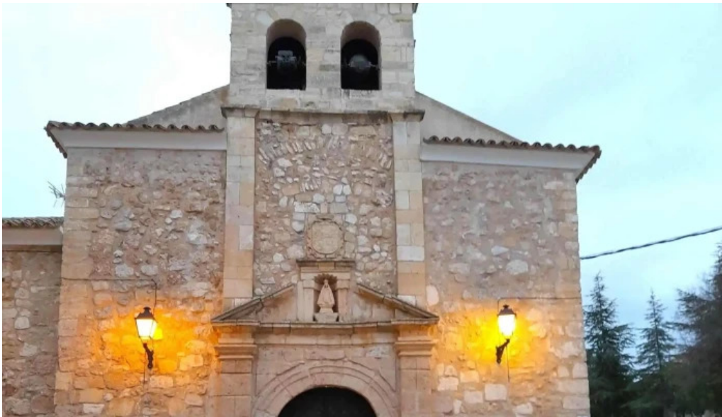
Ermita virgen de gracia belmonte