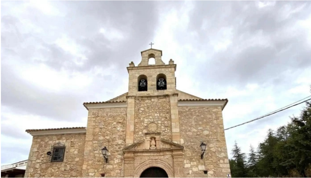
Ermita virgen de gracia puntaje