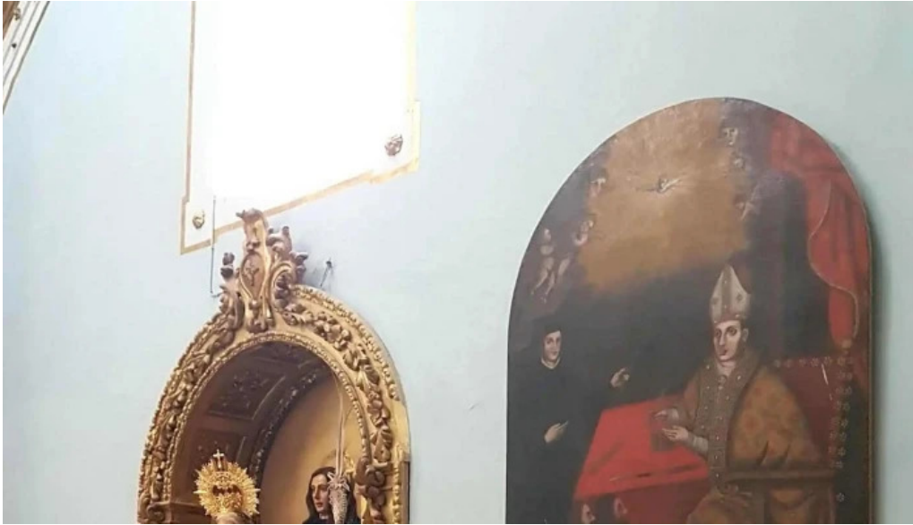
Ermita virgen de gracia catalogo