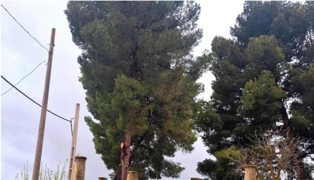
Ermita virgen de gracia promocion