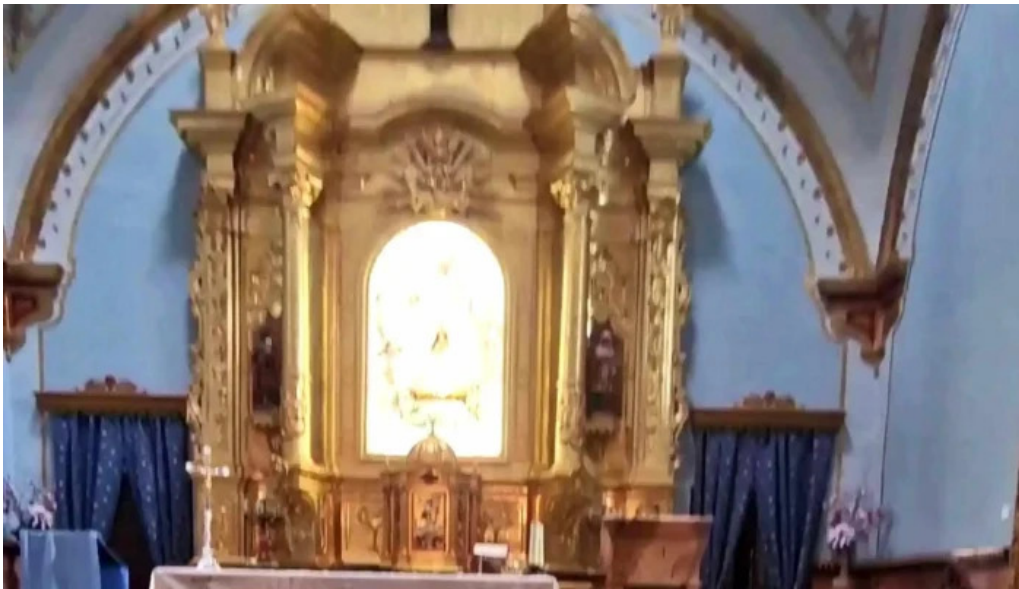
Ermita virgen de gracia horario