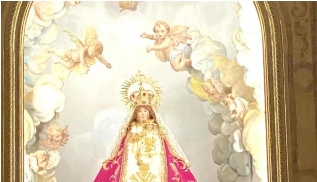
Ermita virgen de gracia cerca de mi