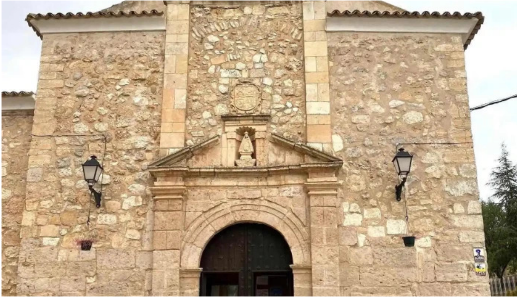
Ermita virgen de gracia lugar de culto