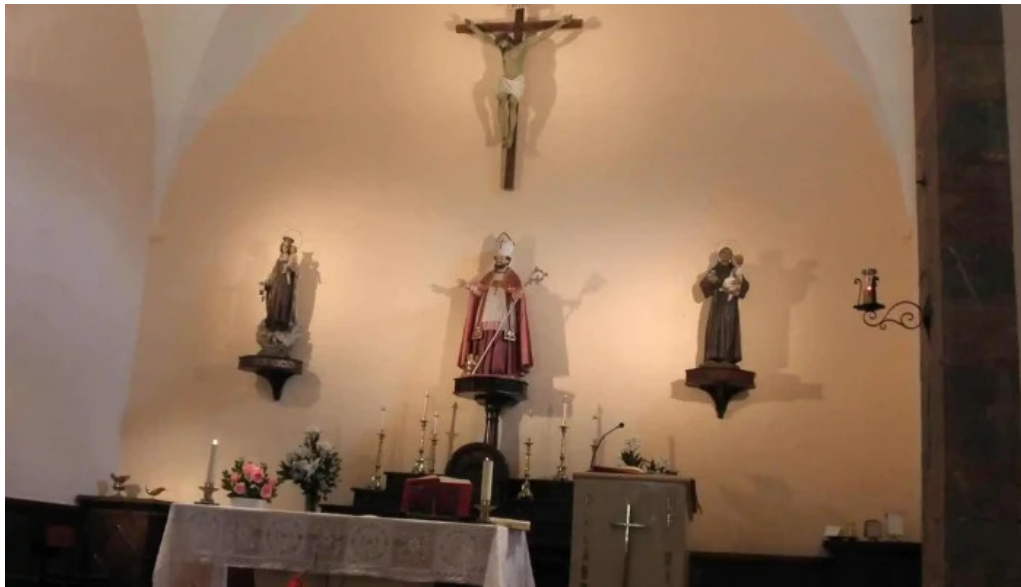
Iglesia de san nicolas lugar de culto