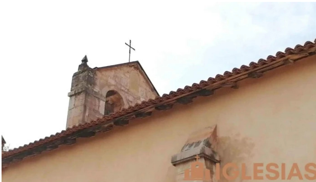
Iglesia de san nicolas videos