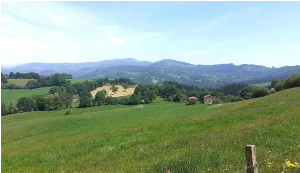
Karrantza haranavalle de carranza iglesias