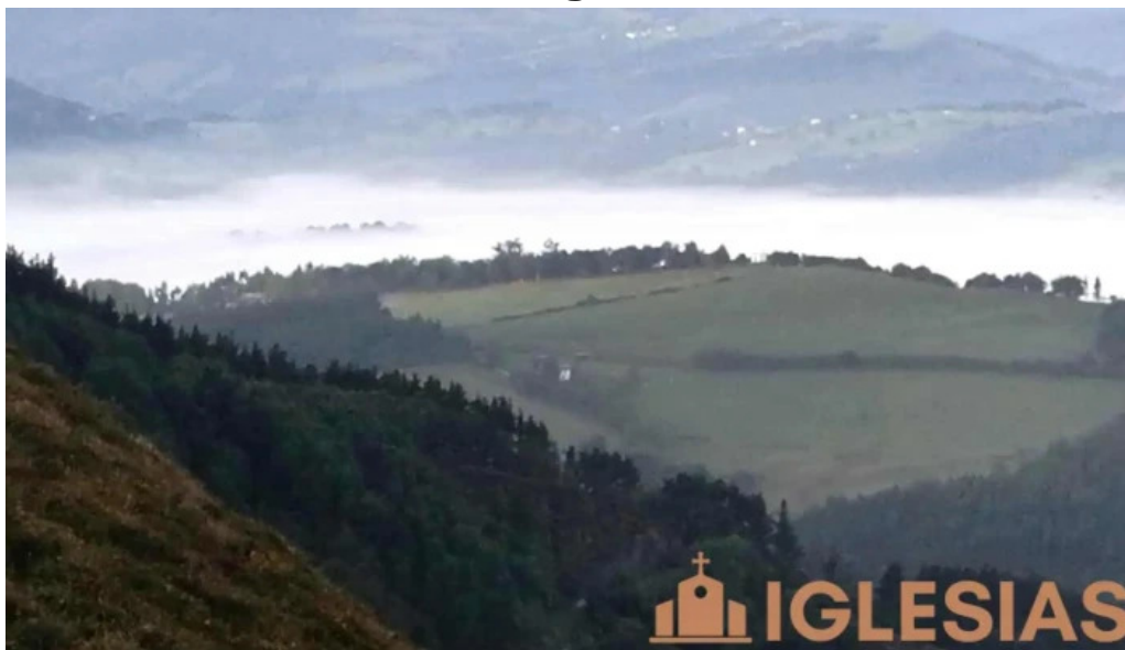
Karrantza haranavalle de carranza videos