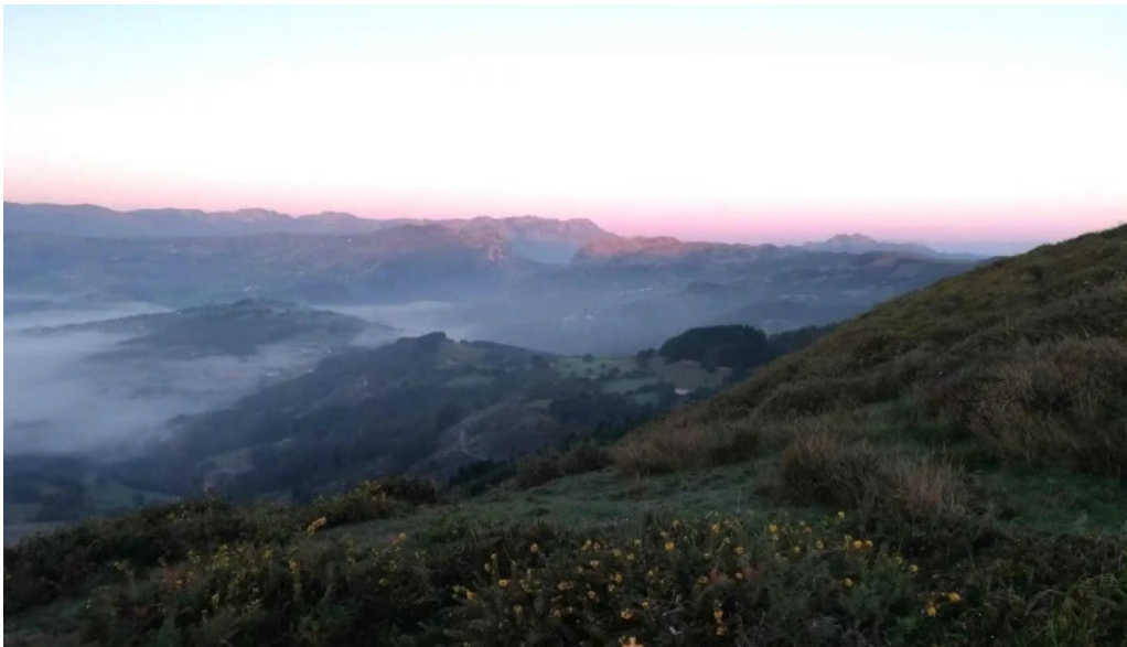
Karrantza haranavalle de carranza montana