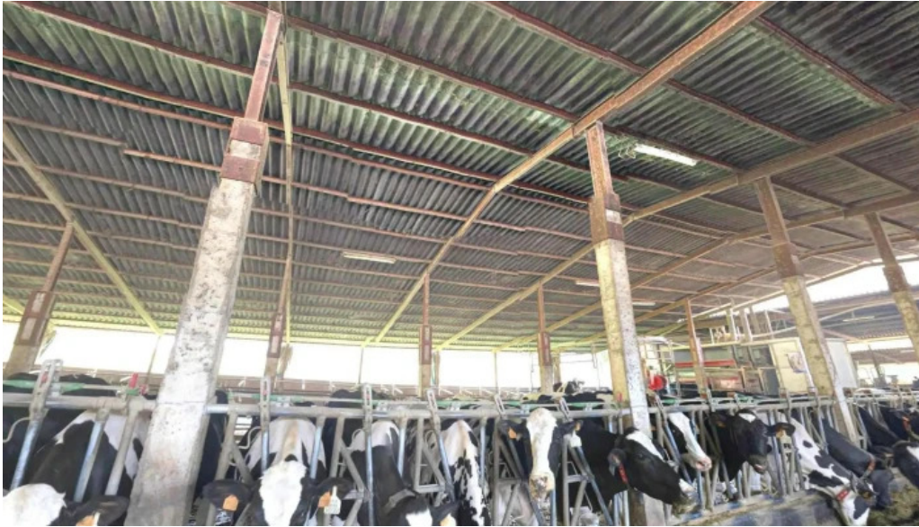
Karrantza haranavalle de carranza telefono